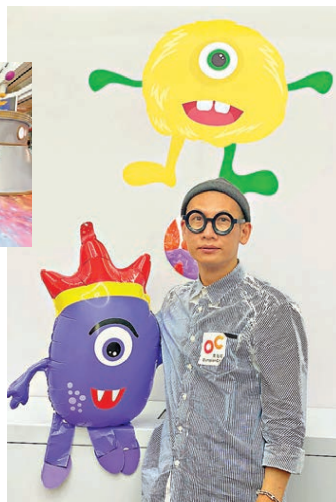
鍾燕齊願為小朋友的想像力留一片天地。