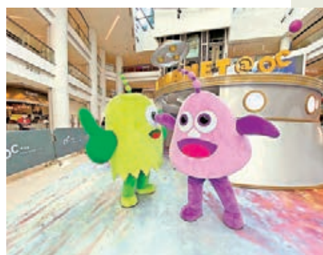
由小朋友自行設計的外星人形象。

鍾燕齊的藝術生涯開始得既早且持久，他畢業於大一藝術設計學院，之後投身廣告及電影創作行業，其後留學日本東京，師承國際知名日本收藏家及策展人北原照久先生，開展香港社會民生產物對本地文化、設計及藝術影響的研