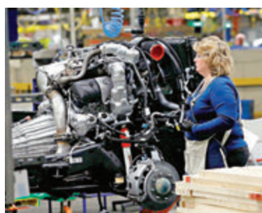
通用不再支持特朗普的法律戰。

美國大型汽車生產商通用汽車宣布，將不再支持總統特朗普政府挑戰加州制訂本身燃油效率法規權力的法律戰，稱通用汽車的綠色汽車目標，與加州當局和總統當選人拜登的新政府一致。