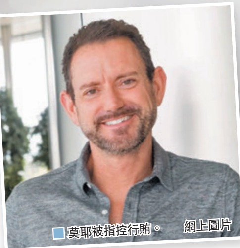
莫耶被指控行賄。