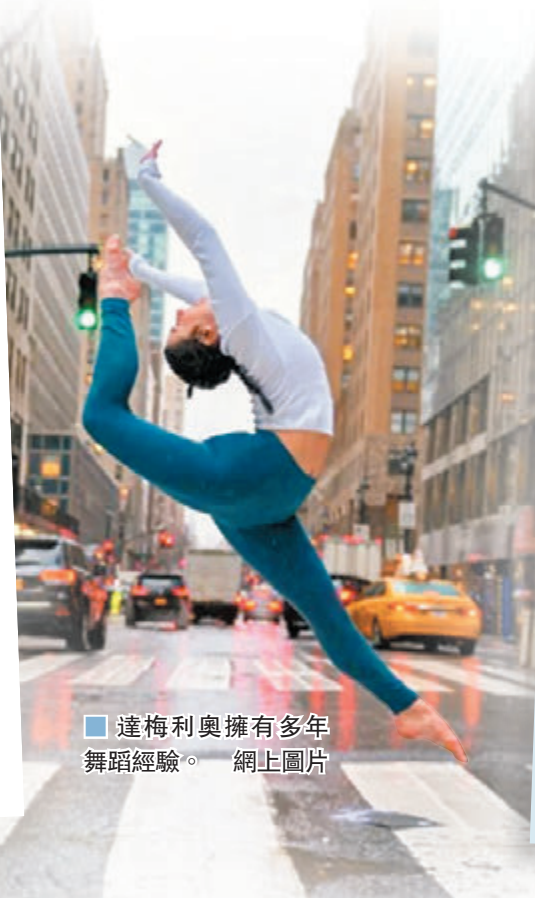
達梅利奧擁有多年舞蹈經驗。