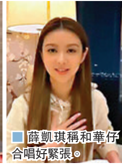
薛凱琪稱和華仔合唱好緊張。