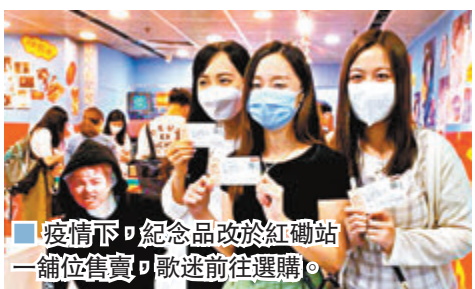
疫情下，紀念品改於紅館站一舖位售賣，歌迷前往選購。

紅館，因為紅館前、後台大部分位置都嚴禁飲食。為免人羣聚集，軒仔又細心通知歌迷，完場後不用到後台開外等候，因他完場後會秒速返家「淨身消毒」，不會跟歌迷見面。 演唱會在 80 位中樂團團員和樂隊伴奏下正式開始，穿上大禮帽上超長羽毛帽子的軒仔，在四面台中間的旋轉舞台上上升出場，他獻唱《酷愛》後向觀眾打招呼：「紅館我返來啦！大家都返來啦，多謝大家。」雖然紅館只開放容納一半觀眾，但無損現場氣氛，軒仔說：「相比以往如果見到現在的入座率，一定會不開心，但現在見到咁多人來，已經好感激大家。因為要配合場地限制，大家坐得較疏落，無幾何可以擺嘢在隔離位，大家肯來就得，肯來我就肯唱，唱幾多都得。」軒仔又稱演唱會籌備期間一直想着四個字「得來不易」，製作要求高，在有限辦法之中發揮最大創意。軒仔表示演唱會不設握手環節，希望大家以另一角度欣賞音樂。