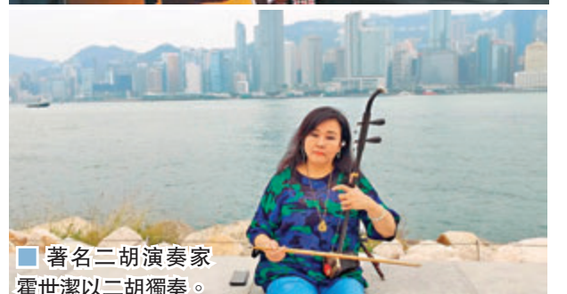
著名二胡演奏家霍世潔以二胡獨奏。