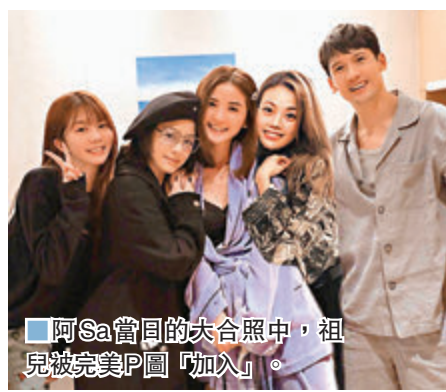
阿Sa會同的大合照中，祖兒被完美P圖「加入」。

阿 Sa 聲帶出現問題被困擾了好一段時間，至今仍在治療中，不過她預告無論進展如何，也