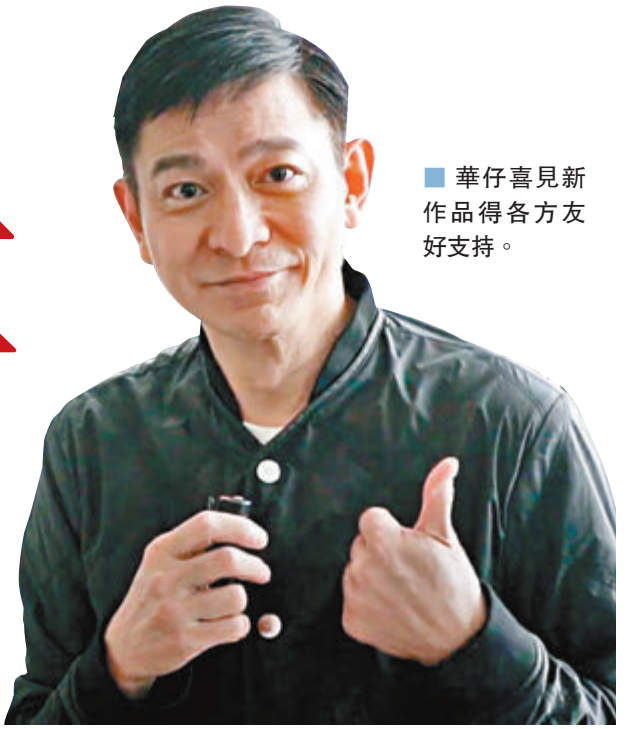
華仔喜見新作品得各方友好支持。