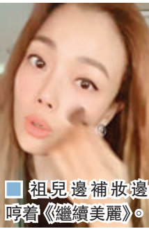
祖兒邊補妝邊哼着《繼續美麗》。