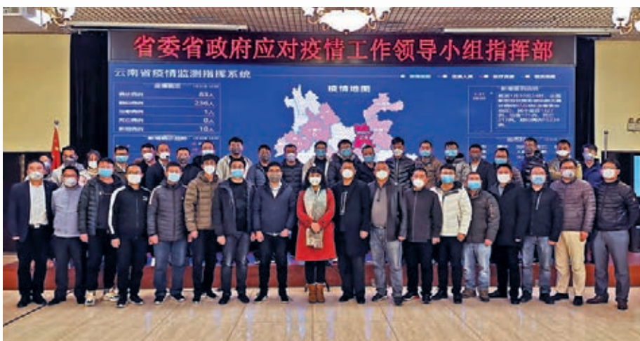
■浪潮雲南抗疫小組

在這些年推動高原特色農業，打造世界一流「綠色食品」的過程中，雲南也與周邊其他地區一樣，面臨着產品生產標準不一致，品質監管難、大產業、小規模，入門門檻低，劣幣驅逐良幣的現象。如何利用資訊技術為雲南打造綠色食品品牌保駕護航？鄭昕介紹稱，去年配合農業農村廳一起開展了一系列工作，浪潮方面把長期以來積累的氣象資料、地形地貌資料、耕地資料和產業資料進行了匯聚，打造了