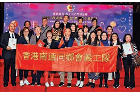
■香港南通同鄉會義工隊受香港義工聯盟嘉許