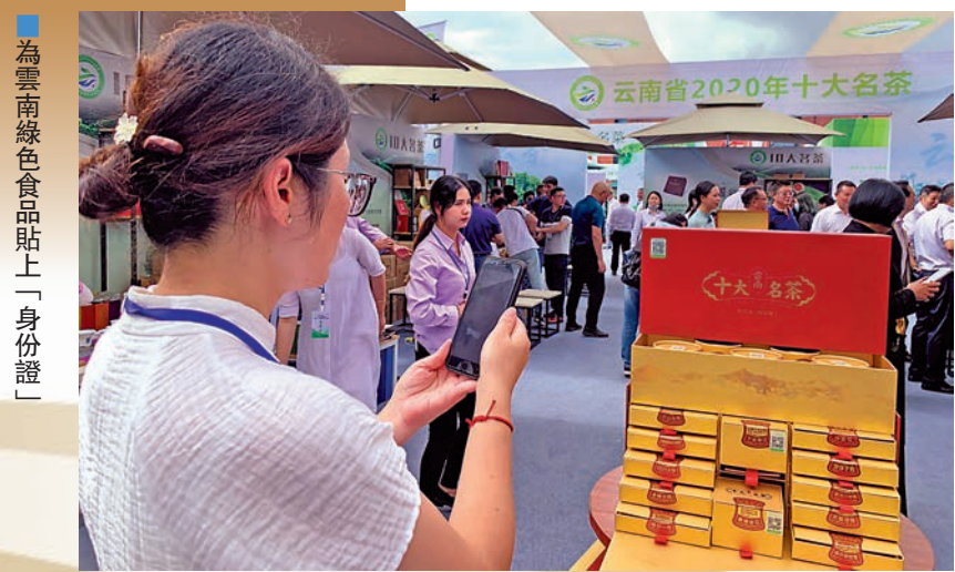
■為雲南綠色食品貼上「身份證」