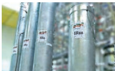
■美國退出核協議後，伊朗隨即發展核技術。 資料圖片

據報美國總統特朗普上週與多名白宮及軍方高層官員會面時，曾提出襲擊伊朗的核設施，以阻止伊朗繼續發展核計劃，不過在一眾官員及幕僚反對下，暫時放棄念頭。然而特朗普據報仍在尋求如何襲擊其他伊朗資產或盟友。