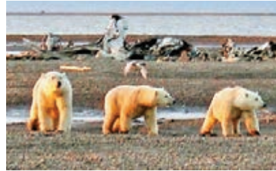
■北極國家野生動物保護區有大量珍貴動物。

美國總統當選人拜登承諾上任後會永久保護阿拉斯加州的北極國家野生動物保護區，禁止在區內開採油氣，不過這個大計可能被現任總統特朗普打亂。特朗普政府昨日就拍賣保護區內約65萬公頃土地正式展開30日公開提問及意見期，務求趕於拜登上任前，讓石油企業取得在保護區內鑽探的權利。