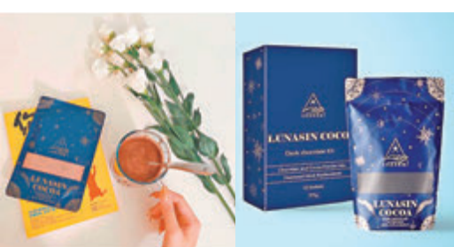
黑可可代餐，只需用冷水沖泡即可。

很多人覺得減肥需要不停節食和運動，卻又因為繁忙的工作導致減肥計劃不似預期。因此，針對忙碌的都市人，廠房設於台灣的Shaumi最近推出了黑可可代餐Lunasin Cocoa，其便攜式設計只要加水即可飲用，配合獨家減重素材——大豆胜肽，輕鬆減肥無難度。其黑可可代餐含獨家減重素材：大豆胜肽，有助降低血液中游離脂肪酸，增加瘦素與脂聯素，可降低食慾及加速脂肪代謝。而另一減重素材白腎豆萃取阻斷脂肪，抑制油脂吸收，隔斷外來油膩物。黑可可代餐為每30克分量，低於100卡路里，而且更貼心為都市人設計飲用包裝，以最簡單方便為主，包裝設計上增加了可