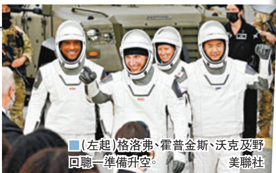
■(左起)格洛弗、霍普金斯、沃克及野回聰一準備升空。

「龍」飛船由SpaceX研發的可重用「獵鷹9」號火箭搭載升空，參與任務的太空人因應今年發生的眾多事件，包括席捲全球的新冠疫情，特將他們的飛船命名為「堅韌」號。飛船原定上周六升空，但因天氣問題延遲一日，於美國東岸時間周日晚上7時27分(香港時間昨晨8時27分)，於佛羅里達州肯尼迪太空中心順利升空。