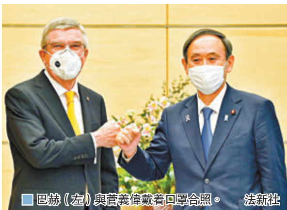
■巴赫(左)與菅義偉戴着口罩合照。

訪問日本的國際奧委會主席巴赫昨日與日本首相菅義偉舉行會談，雙方一致確認，明年東京奧運會將如期舉行，菅義偉亦表明，希望舉辦有觀眾觀賽的奧運，成為人類戰勝