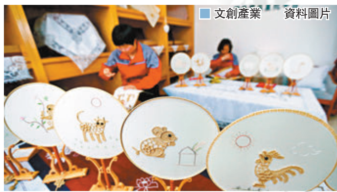
文創產業 資料圖片

文化創意產業與通識教育在創造性、人文性及其現世關懷上體現了共同的特徵。大學的通識教育倡導博雅的人文精神，闡釋歷史文化的時代意義是其中一項重要的貢獻。通識課程兼容