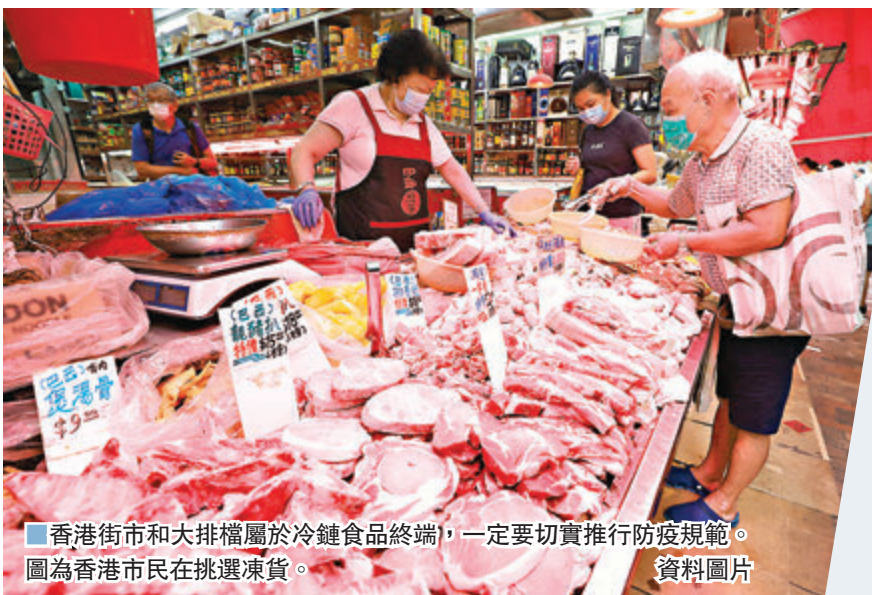
香港街市和大排檔屬於冷鏈食品終端,一定要切實推行防疫規範。圖為香港市民在挑選凍貨。

對於內地應對新冠方面對香港的警示,朱毅表示,上海、安徽發現了疑似病毒搭載非冷鏈貨物入境的例子,原因在於天氣溫低,大環境開始接近冷鏈,病毒僥倖存活。加之搬運的是入境感染者受到污染行李,病毒還能在表面存活。香港作為航空樞紐,機場入境人群中存在病毒攜帶者的風險高,機場裝卸人員若不規範作業,就容易增加被感染風險。因此,機場碼頭對來自於疫情肆虐地區的非冷鏈物品亦不能掉以輕心。