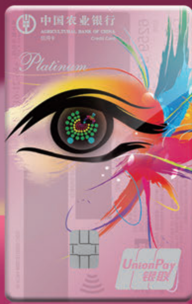
漂亮升級媽媽銀聯白金信用卡 (清新版)