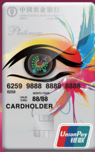
漂亮升級媽媽銀聯白金信用卡