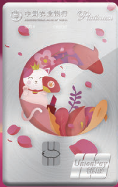
C位出道版年輕白金信用卡 (限30周歲以下客戶申請)