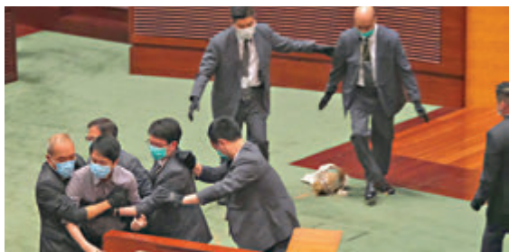
▲攪炒派議員曾在會議廳內搗亂，拋擲臭味異物。資料圖片

本月11日全國人大常委會表決通過的關於香港特區立法會議員資格問題的決定，對參選或就任立法會議員的人的違誓行為及後果作出說明，為社會正本清源。不少人都期望香港特區亦可完善相關本地法例，並將有關規範擴展至適用於所有公職人員。 香港法律界人士近日在回應香港文匯報記者查詢時均認為，因應全國人大常委會的決定，有必要對公職人員就職的宣誓作出立法，並且訂明依法認定違背誓言的機制。此外，特區政府各政策局也可以通過公務員守則的方式，規範受薪於政府部門的公職人員行為，並制定違背誓言的處分。 ■香港文匯報記者 鄭治祖