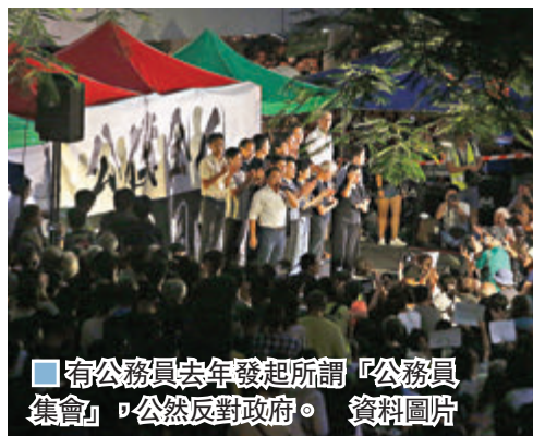
▲有公務員去年發起所謂「公務員集會」，公然反對政府。