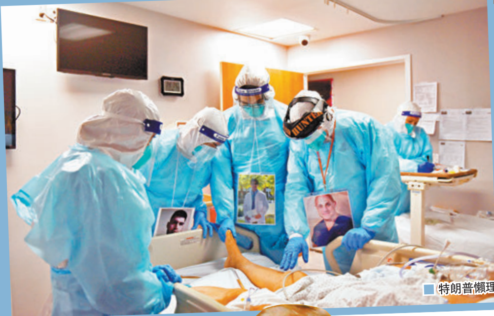
特朗普懶理新冠疫情持續惡化(左圖)及熱帶風暴「埃塔」吹襲(右圖)。

美國總統特朗普在大選後一直拒絕承認落敗，雖然他堅持自己仍是美國總統，而且「將會勝出」，不過美國傳媒卻揭發他從大選日開始，已經幾乎完全不理政事，面對美國持續惡化的新冠疫情、吹襲佛州的熱帶風暴「埃塔」、6名美軍在埃及直升機意外身亡等，特朗普都一於懶理，只顧處理大選後的訴訟戰。特朗普荒廢政事的做法不但遭到民主黨人批評，專家亦憂慮會進一步削弱美國政府應對疫情的能力，導致疫情更加失控。