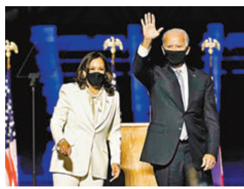
拜登及哈里斯獲不少領袖祝賀。

相反，作風較為開明的方濟各過去4年與特朗普有過很多分歧，特朗普競逐上屆大選時，方濟各就曾批評他的美墨邊境圍牆政綱，形容希望建造圍牆的人「不是基督