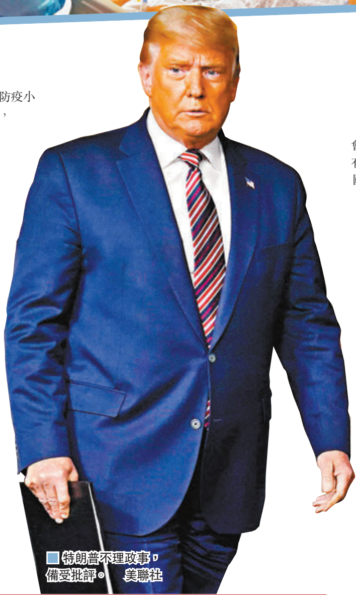
特朗普不理政事，備受批評。