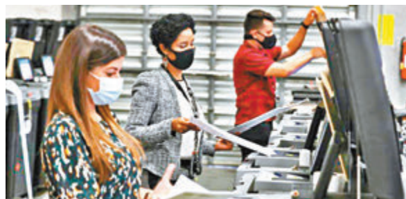
特朗普無理指控投票機將「270萬張選票刪除」。