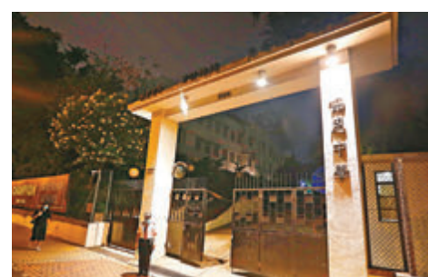
昨日確診的浸大女生在協恩中學當實習教師。