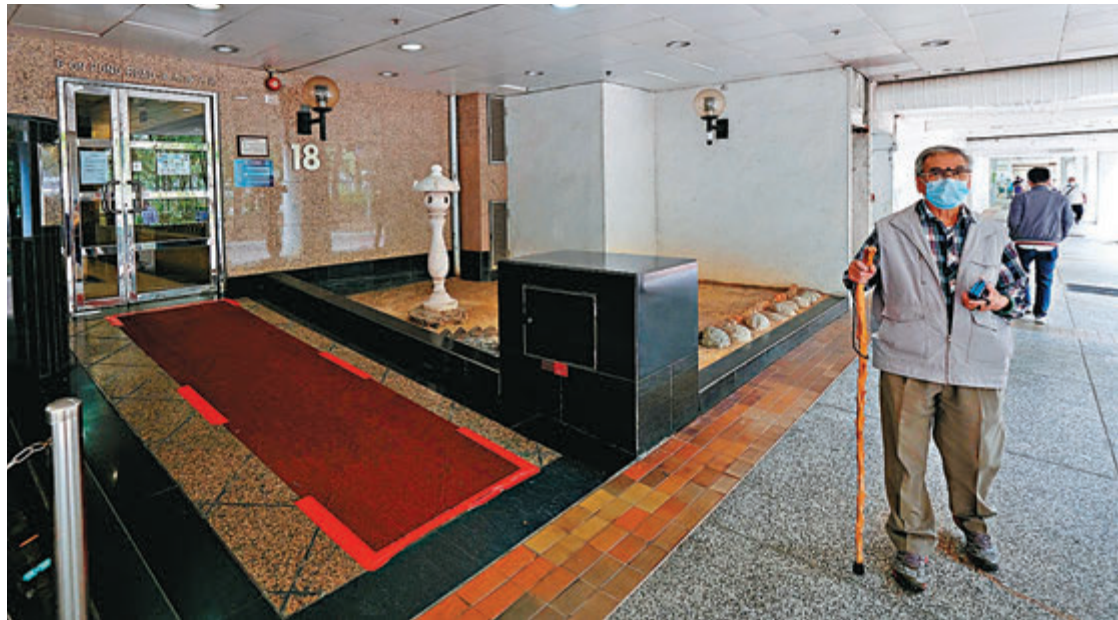
確診的威院李炳醫學圖書館職員居於大埔中心18座。

她指出，本港過去一周出現多宗不明源頭個案，社區有隱形傳播鏈，呼籲市民提高警覺，否則第四波疫情一觸即發，可能較第三波更嚴峻，強調現階段沒有空間放寬社交距離措施，更可能進一步收緊，而近日不少本地個案涉及酒店staycation（宅