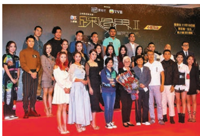
■眾演員為下周開播的《踩过界II》宣傳。