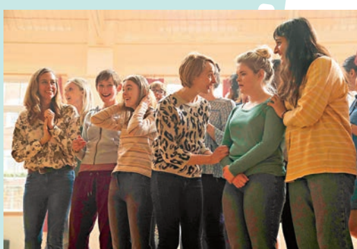
電影真人真事改編，講述軍人妻子組合唱團推出單曲，勇奪流行榜NO.1的寶座。

在《靚太軍樂團》驚喜重現了多首上世紀80年代經典暢銷名曲，包括The Human League的《Don't You Want Me》、Tears for Fears的《Shout》、Yazoo的《Only You》，也有90年代Dido的《Thank You》，這些金曲也是片中角色青少年時期的音樂，同時還與軍事生