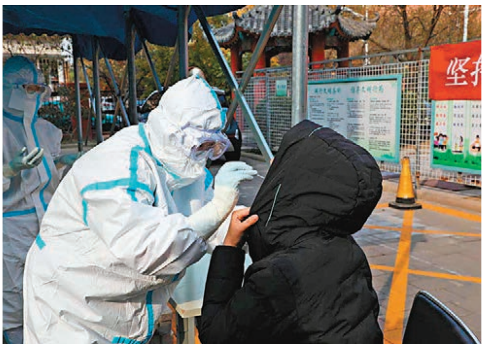
天津近期出現的病例均與冷鏈相關。圖為11月9日當晚，天津濱海新區啓動對漢沽街全區核酸檢測。

對於當其他國家醫療力量無法應對疫情時，中國會否接受其他國家的患者，羅照輝表示，這從政策方向上來說，沒有問題。但是世界衛生組織建議，染疫病人應當減少流動，就地隔離、就地治療。中國也可能考慮派一些專家去協助，提供一些物資支持，包括提供一些設備和中國武漢的方艙醫院經驗等。有些工作已經在做，比如在緬甸、老撾、柬埔寨等國家，中國已提供了幫助。