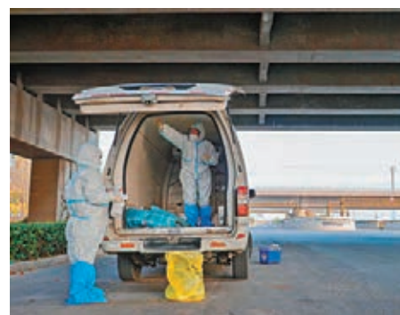
11月10日，天津海關嚴格監管要求，開展進口冷鏈食品監測和消毒作業。圖為工作人員緊張有序地進行着登記、封存、樣品採集、排查等工作。

個陸地口岸、66條邊境通道，並且加強了值守看管，嚴防境外人員繞關避卡入境，並且從嚴限制仍在運行的陸地口岸及邊境通道的人員通行，僅保留貨物運輸功能。今年以來，共查獲毗鄰國家人員偷渡來華的案件700餘宗，查處非法入境的外籍人員5,000多人，有效地防範了疫情經過非法入境的渠道輸入。