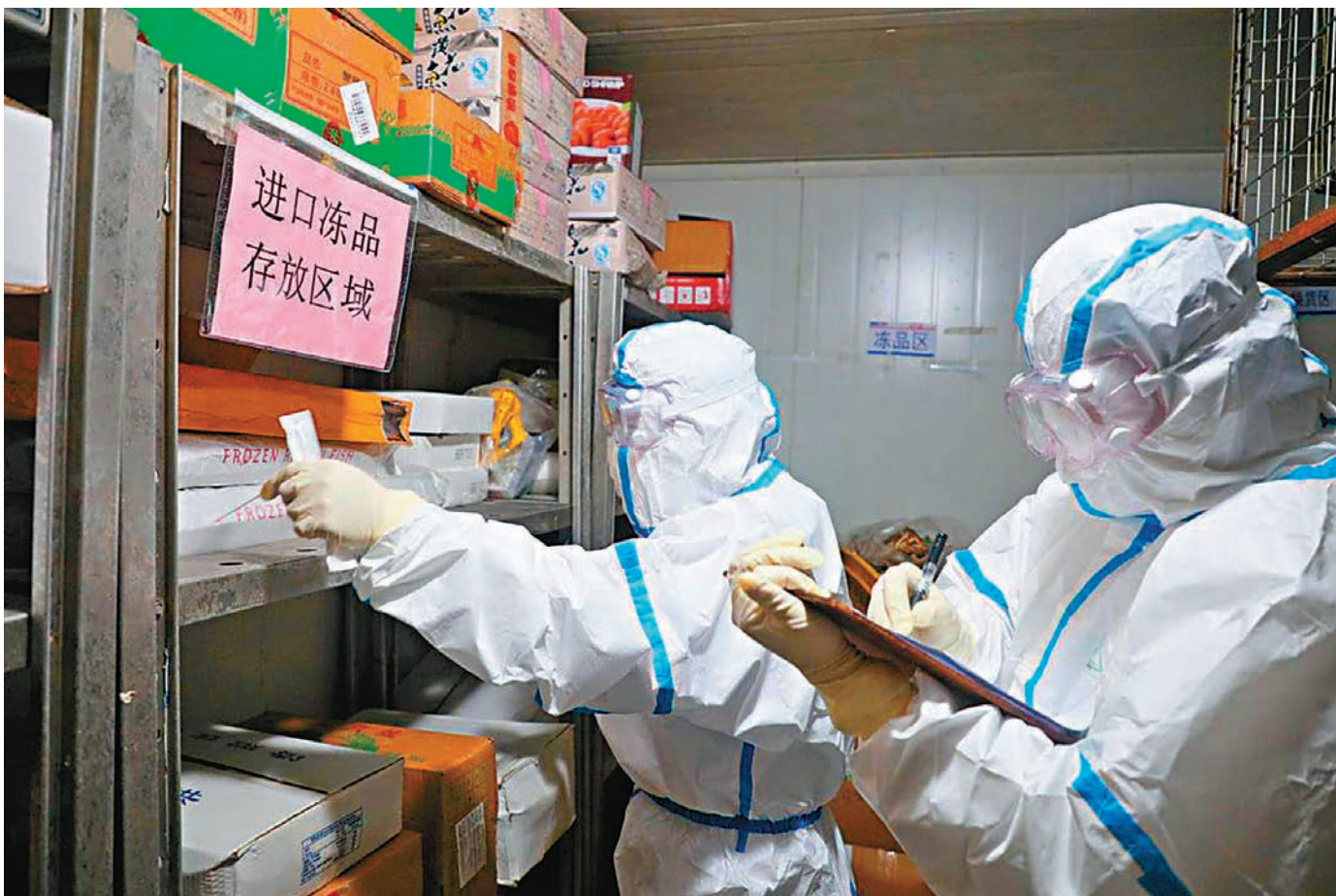
從8日下午開始，津南區市場監管局緊急要求市場暫停經營，同時配合津南區疫情防控指揮部，對從業人員、庫存貨品，以及市場環境開展核酸檢測。圖為工作人員對進口冷凍品進行核酸檢測。

何鵬建議，冷鏈相關從業人員要增強個人防護意識，避免皮膚直接接觸可能被污染的冷鏈食品。裝卸工人在裝卸來自疫情發生地區的進口冷鏈食品時，務必全程規範戴好口罩，避免貨物緊貼面部、手觸摸口鼻。穿戴多個防護用品時，務必確保防護口罩最後摘除。