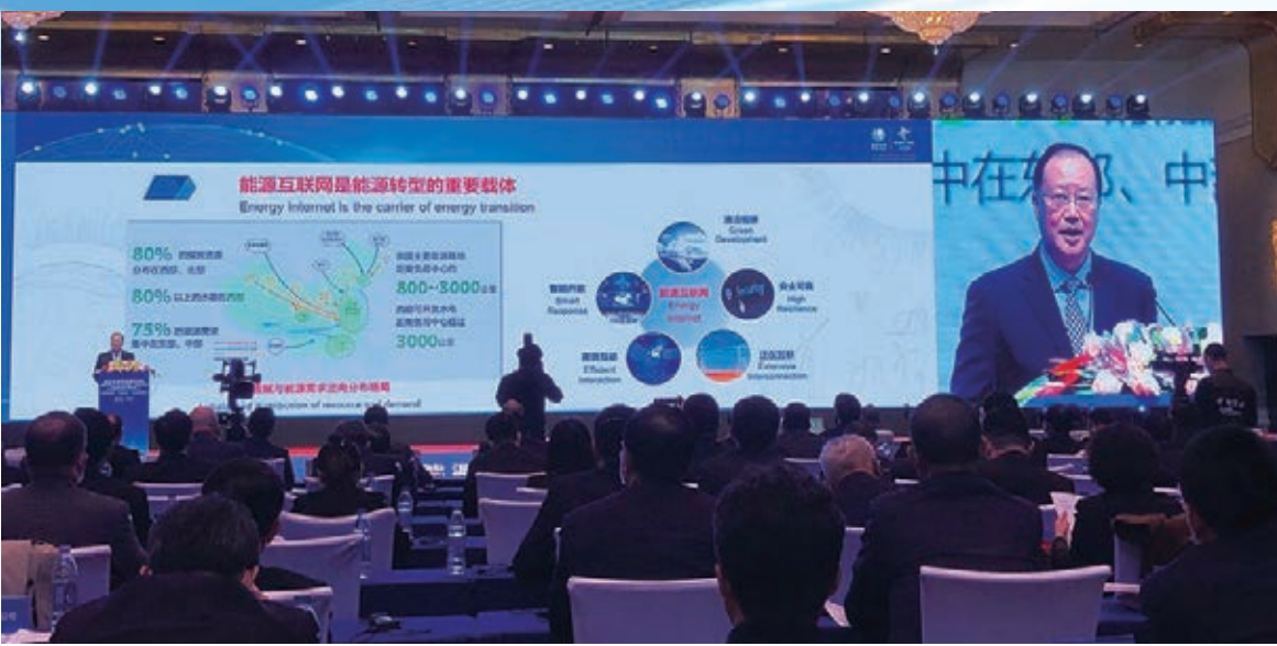
國家電網公司董事長毛偉明發表主旨演講。

由中國國家電網有限公司與世界經濟論壇共同舉辦的2020能源轉型國際論壇10日在京召開。此次論壇以「能源轉型與後疫情時代可持續發展」為主題，來自54個國家和地區的500多位嘉賓通過線上線下的方式，聚焦全球能源行業面臨的機遇與挑戰，積極探索實現可持續發展的路徑與方案，共同推動世界經濟「綠色復甦」和全球能源轉型發展，極大提振了全球疫後重振的信心。