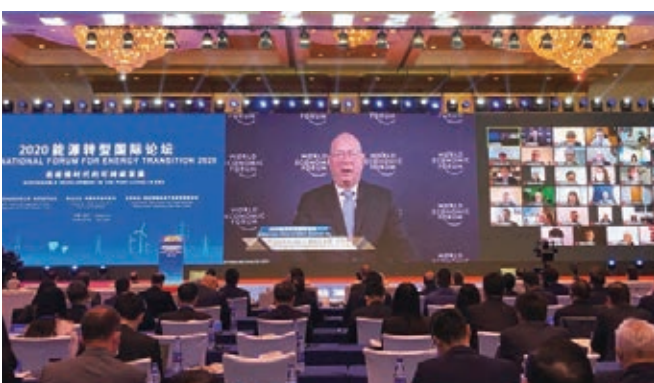
世界經濟論壇執行主席、創始人施瓦布為論壇致辭。

全國政協副主席、中國科協主席萬鋼在論壇上表示，中共十九屆五中全會把創新作為國家發展的核心戰略，明確了在「十四五」期間要實現能源資源配置更加合理、利用效率大幅度提高，主要污染排放物總量持續減少的近期目標，在2035年遠景目標中特別強調要在碳排放達到頂峰後穩步下降。加快能源的綠色低碳