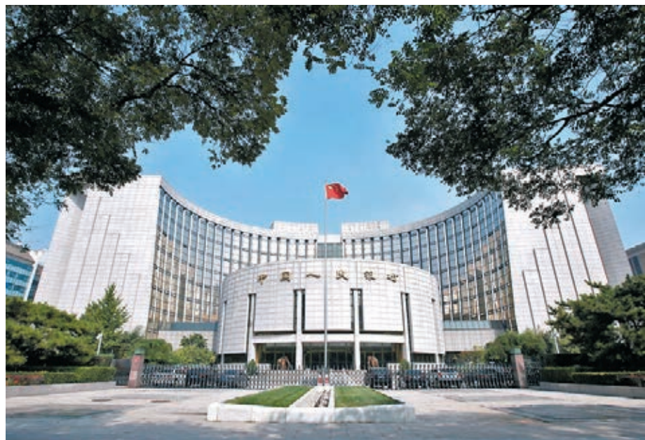
人民銀行公布10月新增貸款6,898億元人民幣，略低於市場預期。不過分析認為，10月信貸結構較好，料貨幣政策暫時無需大幅調整。資料圖片

從信貸結構來看，10月的新增信貸中，居民和企業中長期貸款貢獻主要增量，企業短期借款連續兩個月減少，票據融資由增轉降。數據顯示，10月，住戶部門貸款增加4,331億元，其中，短期貸款增加272億元，中長期貸款增加4,059億元；企（事）業單位貸款增加2,335億元，其中，短期貸款減少837億元，中長期貸款增加4,113億元，票據融資減少1,124億元。社會融資方面，除新增貸款外，增量主要來自企業和政府的債券融資，其中，企業債券淨融資2,522億元，同比多490億元；政府債券淨融資4,931億元，同比多3,060億元；此外，非金融企業境內股票融資大幅增長，達到927億元。