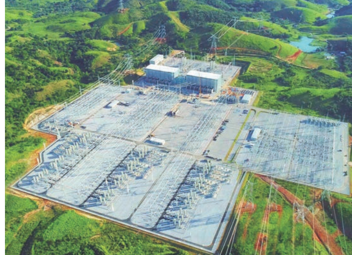
國家電網運營建設的巴西美麗山二期工程里約換流站。

同此涼熱，人類命運與共。能源是現代社會的「血液」，是實現經濟增長的動力引擎。後疫情時代如何實現能源、經濟、環境協調可持續發展，是國際社會面臨的共同課題。為此，毛偉明提出三點倡議。一是政策上加大支持力度，將能源轉型作為經濟復甦的重點舉措，強化資金投入與政策傾斜，引導各類資本更多投向新能源、能源互聯網等領域。二是技術上加強交流合作，圍繞大規模儲能、新能源並網消納、源網荷儲協調互動等技術難題，開展聯合攻關，加快取得突破。三是能源基礎設施上加速互聯互通，在開放合作中提高能源安全風險抵禦能力，促進各國資源共享與優勢互補，推動構建能源領域命運共同體。