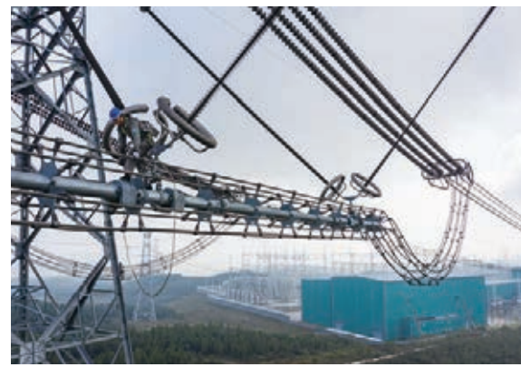
電力檢修人員在100多米高空對±1100千伏吉泉特高壓輸電線路進行檢修。

國家電網公司是全球最大的公用事業企業，在中國境內，經營區域覆蓋中國國土面積的88%，供電人口超過11億；在境外，投資運營9個國家和地區的骨幹能源網。2019年底資產總額5723億美元，全年實現營業收入3839億美元，位列《財富》世界500強企業第3位。