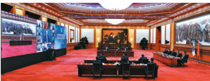
■習近平在北京以視頻方式出席會議。