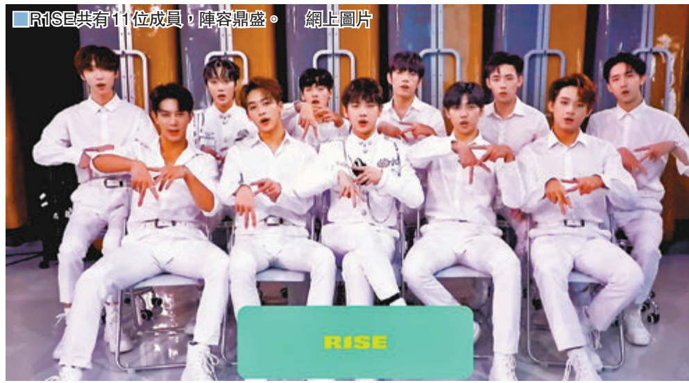
R1SE共有11位成員,陣容鼎盛。網上圖片