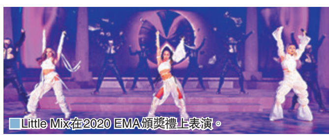
Little Mix在2020 EMA頒獎禮上表演。

今年MTV歐洲音樂頒獎禮以預錄形式進行,並改為線上播放頒獎,由英國團體Little Mix主持。路透社報導,團員Jesy Nelson沒有現身,據說是因為身體不適。Little Mix昨天亦贏得最佳流行藝人獎。美國樂壇天后Lady Gaga今年獲得7項提名,包括最佳藝人、最佳錄影帶、最佳歌曲、最佳流行歌手等獎,最終順利拿下最佳藝人獎。