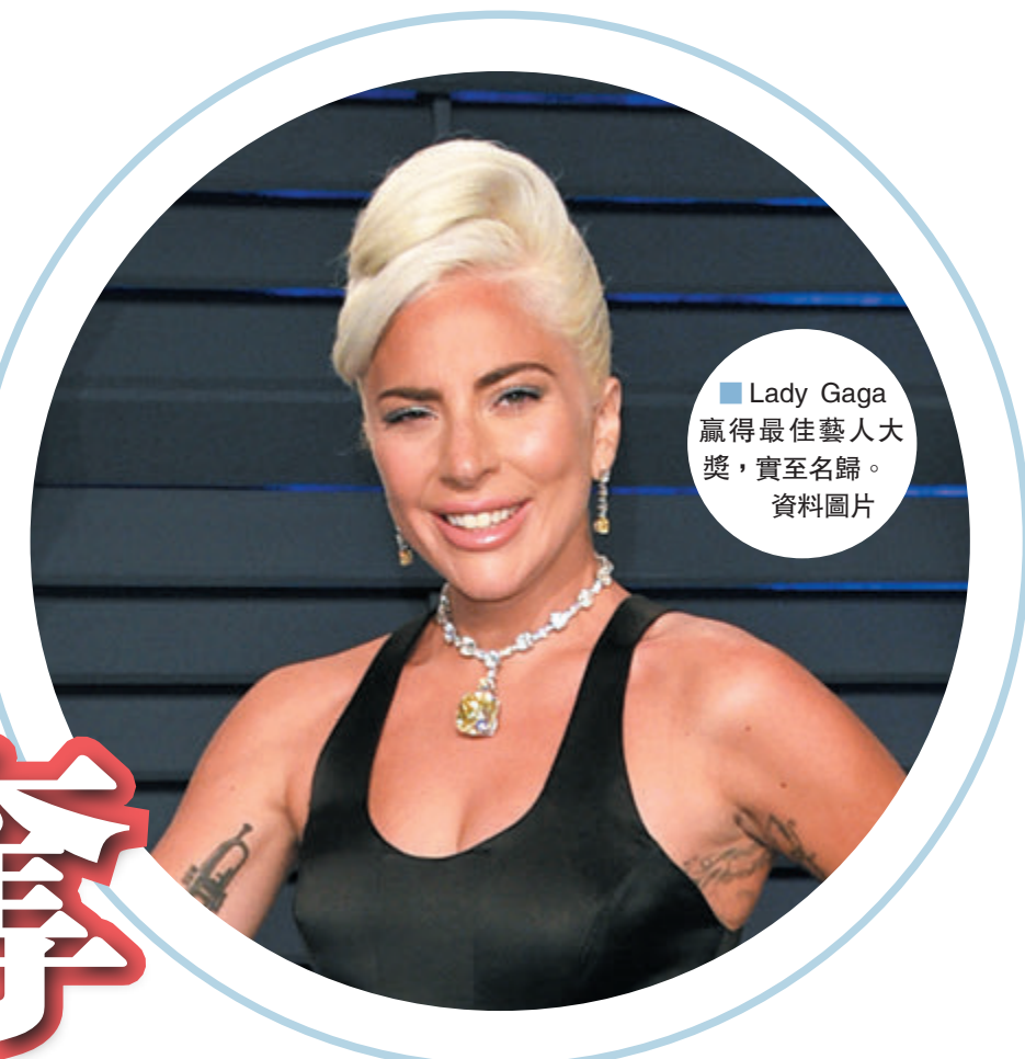
Lady Gaga贏得最佳藝人大獎,實至名歸。資料圖片