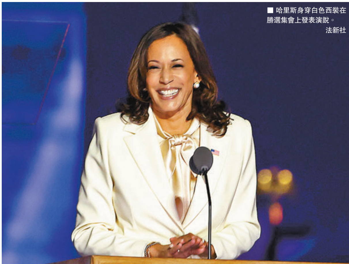
哈里斯身穿白色西裝在勝選集會上發表演說。