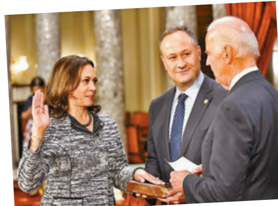
哈里斯2017年宣誓就職加州參議員。

若單論從政資歷，曾經擔任加州檢察總長及聯邦參議員的哈里斯，足夠參選總統有餘。目前社會上亦有不少聲音，討論哈里斯未來成為總統的可能性，前總統奧巴馬的競選經理阿克塞爾羅德便指出，哈里斯當選形成獨特的政治形勢，他形容過往從未有任何一位副總統在進入白宮的首日，便獲「預設為4年後提名戰的領先人選」，同時她亦獲民主黨內左翼視為在白宮內的代表；美國有線新聞網絡(CNN)的主播庫珀則認為，如果哈里斯確實考慮在2024年參選總統，則必須要繼續吸引進步派支持，同時成為較溫和的總統。