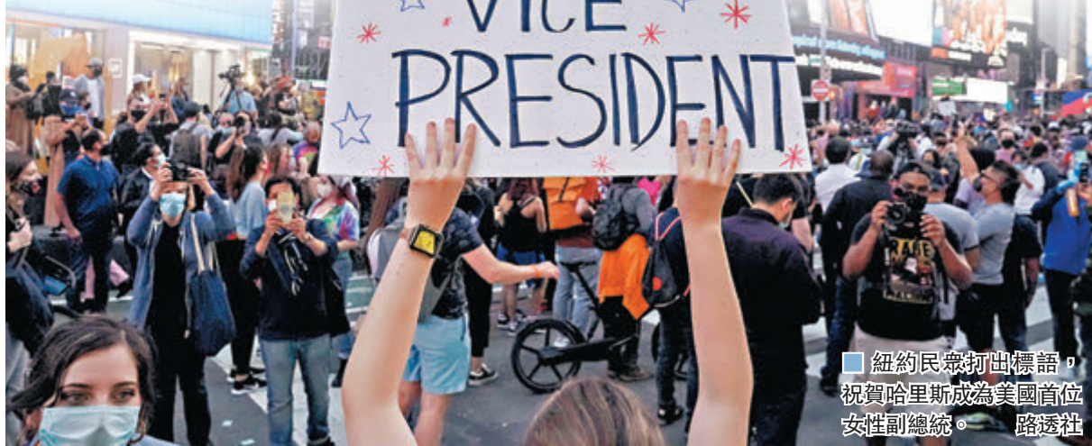
紐約民眾打出標語，祝賀哈里斯成為美國首位女性副總統。