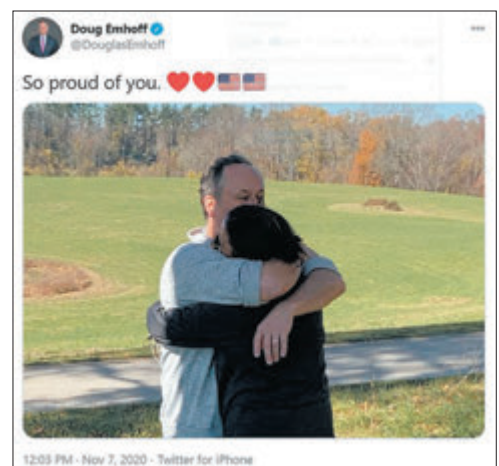
埃姆霍夫twitter發帖祝賀妻子。