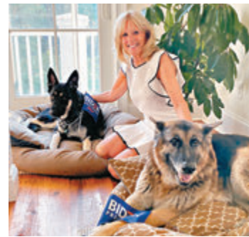
拜登養有兩隻愛犬。

前總統奧巴馬任內白宮飼養一頭黑色葡萄牙水獵犬阿博，另一位前總統布希則養有一頭蘇格蘭梗巴尼，前總統克林頓也有一隻名叫巴迪的拉布拉多犬。總統特朗普4年前就任後，因有潔癖而沒有養狗，成為逾一個世紀以來，首位沒有養狗的總統。