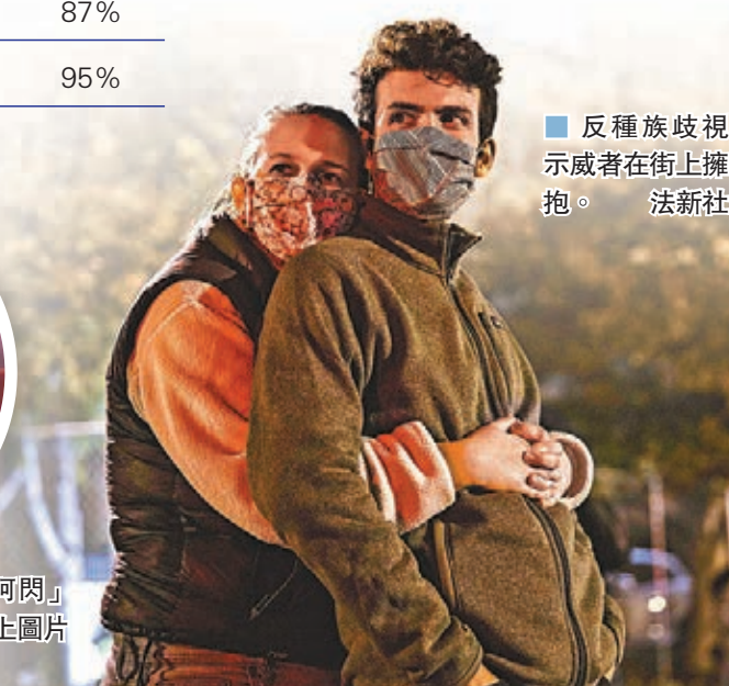
反種族歧視示威者在街上擁抱。