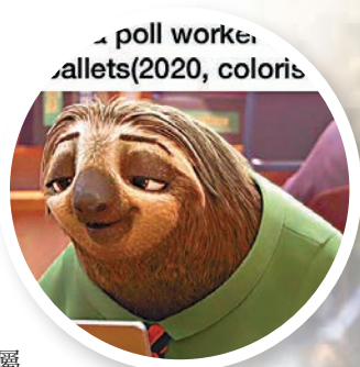
網民借樹懶「阿閃」呻官員點票慢。

示，在當地屬保守立場的安特里姆縣，原本投給總統特朗普的6,000張選票，因點票系統出錯，被錯誤計算為民主黨候選人拜登的得票，而密歇根州全部83個縣中，有47個縣都使用該系統點票。開發商 ElectionSource 昨日發表聲明，證實這次失誤屬當地點票人員的人為失誤，澄清該系統運作良好。