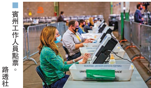
賓州工作人員點票。

美國民主黨總統候選人拜登聲稱勝選在望，據悉其競選陣營籌組的過渡團隊，已緊鑼密鼓展開工作，並與白宮官員合作，計劃盡快擬訂新政府的行政藍圖，首批內閣高官名單或最快一周內出爐。據《紐約時報》報導，拜登過渡團隊由前特拉華州參議員考夫曼領導，遵照拜登的多元化、跨黨派合作的理念進行籌備。團隊將優先考慮抗擊新冠疫情，邀請約20名衛生政策專家，協助制訂疫苗分配及供應等工作，還計劃撤回總統特朗普對金融業的部分行政命令，以便推動新政府經濟政策。