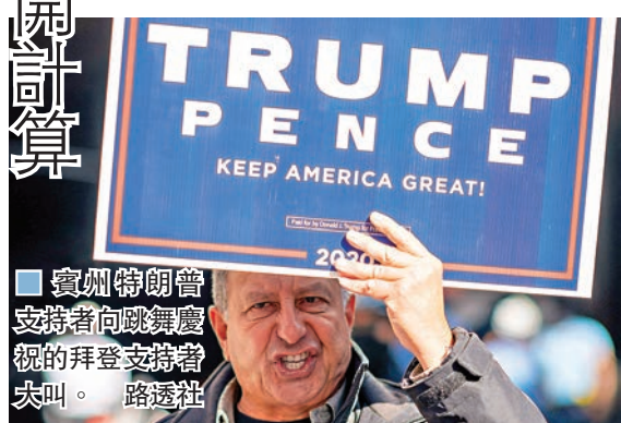
賓州特朗普支持者向跳舞慶祝的拜登支持者發火。