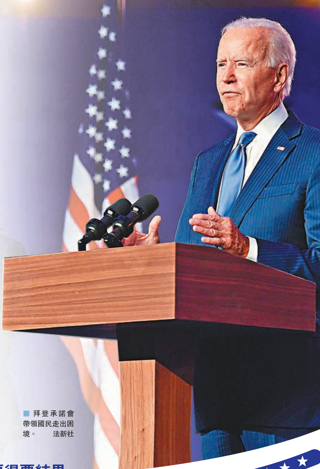
拜登承諾會帶領國民走出困境。