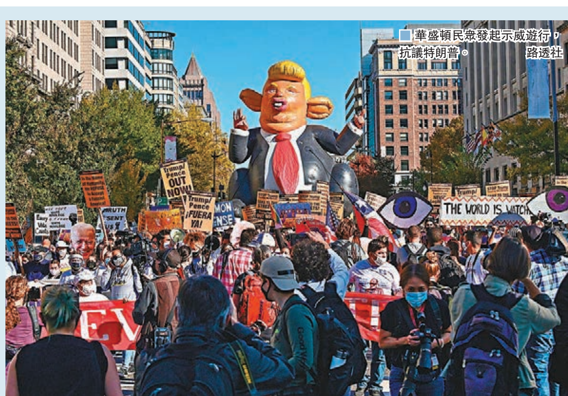
華盛頓民眾發起示威遊行，抗議特朗普。

拜登目前在多個搖擺州的票數領先，有支持者率先發帖，稱拜登為「候任總統」，以及稱呼民主黨副總統候選人哈里斯為「候任副總統」，twitter將這些帖文一律加上標籤。其中一則帖文是由支持拜登的民主黨聯盟共