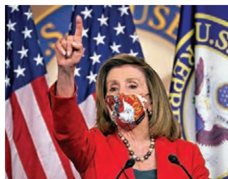
佩洛西已致函民主黨議員，表明有意角逐連任眾院議長。