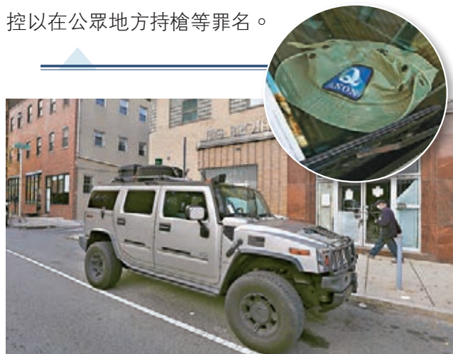
警方在賓夕法尼亞會議中心外截查悍馬汽車，並搜出印有極右組織QAnon標誌的帽子(圓圈)。

美國總統特朗普連日指控大選出現舞弊，其支持者亦在全國各地多個票站外抗議，要求停止點票，並與民主黨候選人拜登的支持者對峙。費城警方表示，日前在用作點票中心的賓夕法尼亞會議中心外拘捕兩名持槍男子，懷疑他們試圖駕車運送假選票到費城，控以在公眾地方持槍等罪名。