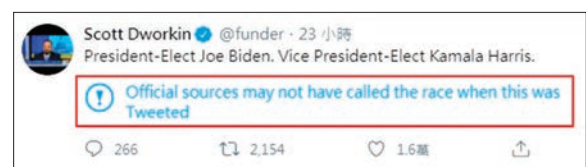
德沃金發帖稱拜登「候任總統」，被標記警告。

敗，twitter將撤銷特朗普作為美國總統在該平台的「特權」，直接刪除其具爭議性的言論，而非像現時般僅加上警告標籤。如果特朗普多次違反平台規則，twitter更可能直接封鎖特朗普的賬戶。