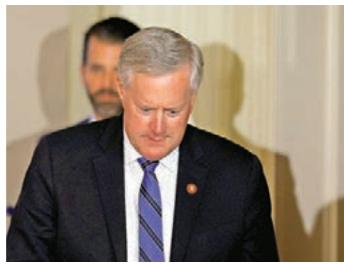
白宮幕僚長梅多斯據報確診新冠肺炎。

在威斯康星州，州長埃弗斯下令將公共聚會人數限制在容納量的25%，但上訴法院暫緩限聚令，埃弗斯表明上訴。「州及地方衛生官員協會」行政總裁弗雷澤形容，人們看似已放棄防疫，州衛生官員甚至討論是否繼續呼籲公眾採取防疫措施，原因在於他們知道很多人根本不會聽從。