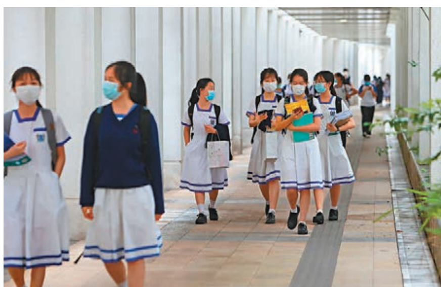
有中小學校長昨日透露，香港近期出現「退學潮」。圖為在沙田崇真中學學生返校。