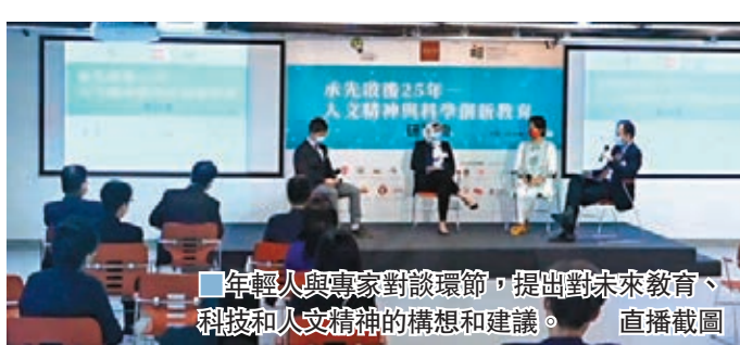
年輕人與專家對談環節，提出對未來教育、科技和人文精神的構想和建議。直播截圖