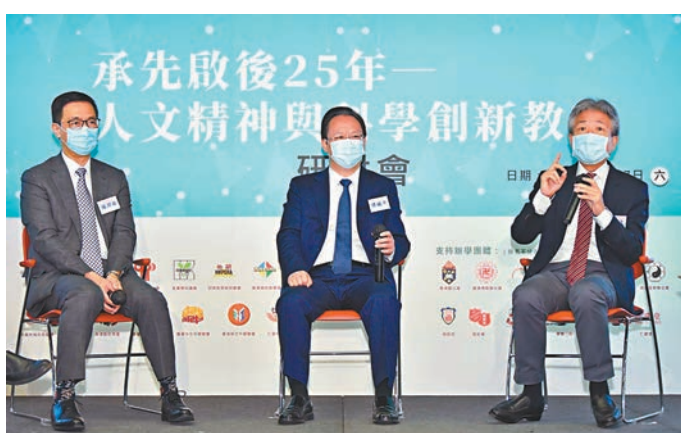
左起：楊潤雄、譚鐵牛、張仁良應邀於研討會發言並一齊討論教育的未來發展方向。

他指出，科學與科技發展的初心是造福社群，當有新事物出現時，更要維持做人基本原則及基本態度，令社會向前發展。科學與人文教育兩者應結合，科技愈進步，就愈要增強培養科研人才、和科技專才的人文精神與高尚品格，同時要堅守正確的價值導向。楊潤雄強調，青年學生在學習及應用科技創新的同時，必須具備明辨思維、團隊協作能力、持守正面價值觀，成為負責任及具建設性的資訊創建者，為國家和社會作出貢獻。