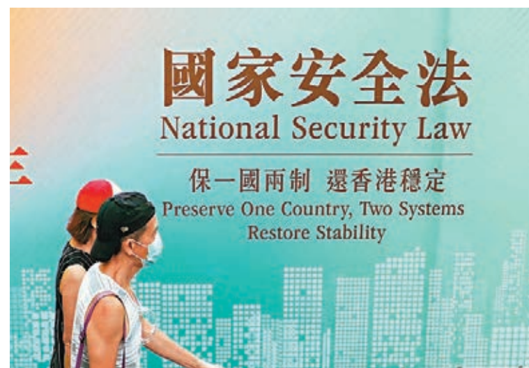
美國「國會及行政當局中國委員會」早前發表所謂香港特區在香港國安法通過後的人權狀況分析報告，特區政府日前對報告中提及的謬論一一駁斥。資料圖片

香港國安法是為了防範、制止和懲治極少數危害國家安全的違法分子，並只針對四類危害國家安全的行為和活動，對絕大多數奉公守法的人士，包括香港居民和海外投資者沒有影響。特區政府依法保障在港生活、經商人士的合法權益的決心不變。