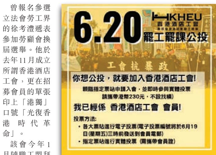
香港酒店工會疑似用「公投」文宣，誤導群衆付費加入其工會。

曾報名參選立法會勞工界的徐考禮選表參加勞顧會換屆選舉。他於去年11月成立所謂香港酒店工會，更在招募會員的單張印上「港獨」口號「光復香港 時代革命」。