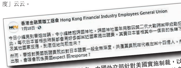
香港金融業職工總會此前狂言，中國外交部針對美國實施制裁，以及日本參拜靖國神社的譴責內容「全無深度」。