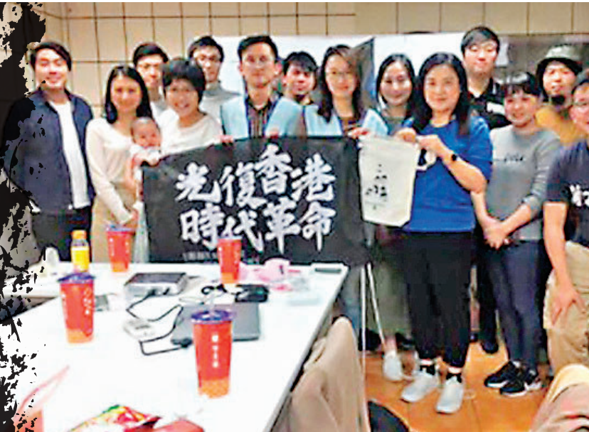
香港酒店工會今年隨職工盟拜訪台灣民進黨總部，更展示寫有「光復香港 時代革命」的「港獨」旗。香港酒店工會fb截圖