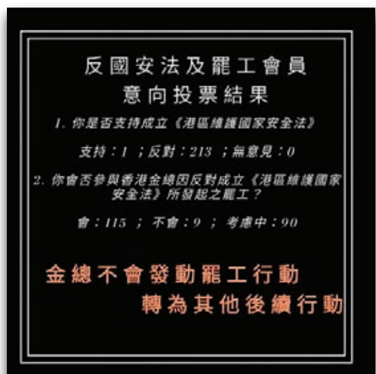
香港金融業職工總會聲稱要在業界號召10萬名罷工，惟最終因只得115人響應而被迫告吹。

該會今年7月更聲言，日本參拜靖國神社其實是想看看中國是否已「向前走未」，又聲稱中國外交部針對美國實施制裁，和日本參拜靖國神社的譴責內容「全無深度」云云。