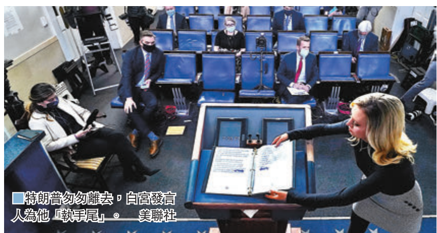
特朗普勿勿離去，白宮發言人為他「執手尾」。

美國大選多個關鍵州份雖仍未完成點票，但隨着民主黨候選人拜登在多個州份收窄差距甚至反超，總統特朗普的形勢已愈來愈不利。不過特朗普前日仍然拒絕認輸，更繼續發表虛假言論，在twitter上連續40小時不斷發文要求停止點票，又親身在白宮記者會上散播「選舉舞弊」的謠言，稱如果只點算「合法選票」，他可「輕易勝出」。堂堂「民主大國」的領導人，竟然公然攻擊自己國家的選舉制度，就連3家主要電視台都看不過眼，認為特朗普「謊話連篇」，罕有地中斷了特朗普記者會直播。