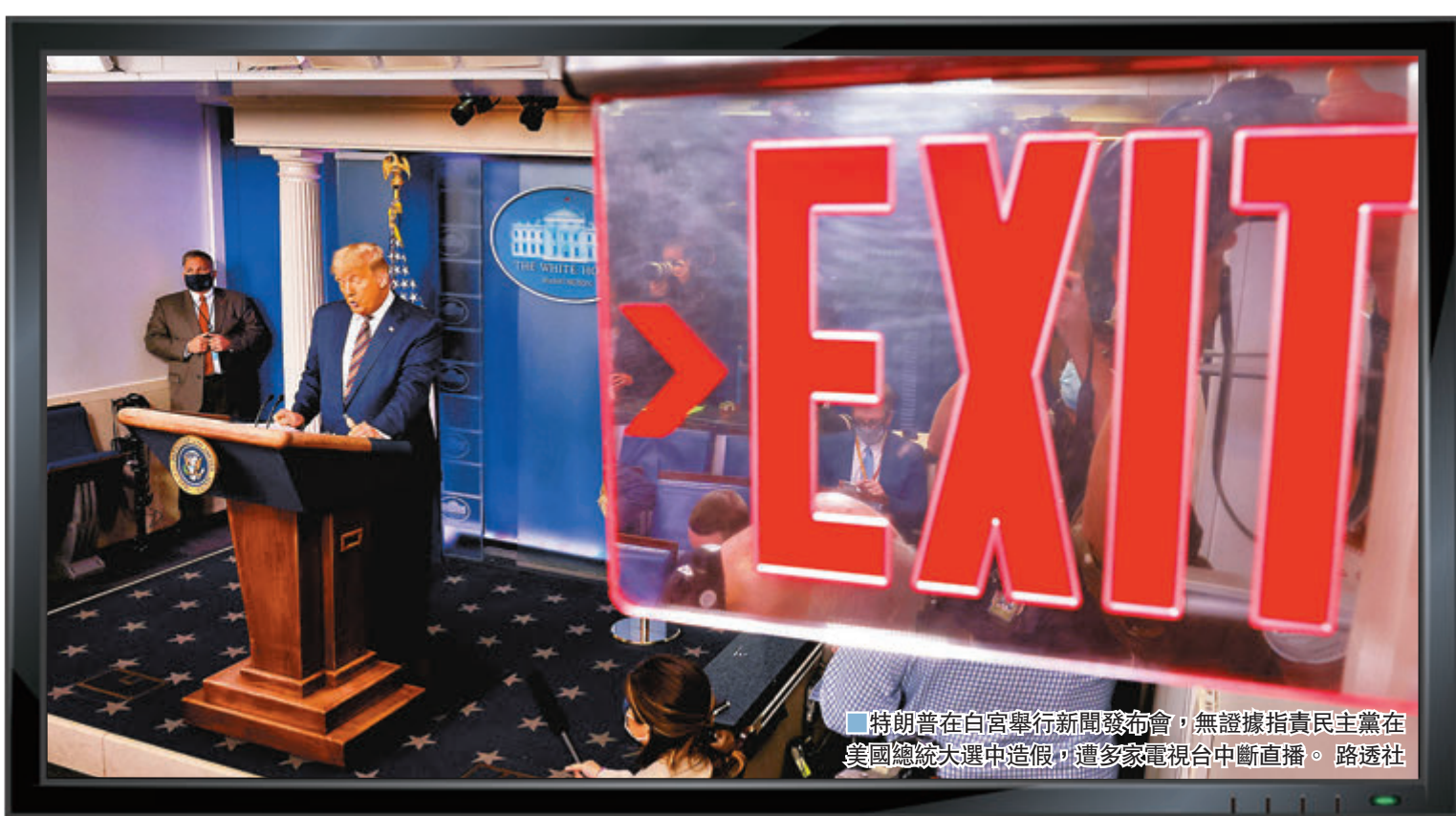
特朗普在白宮舉行新聞發布會，無證據指責民主黨在美國總統大選中造假，遭多家電視台中斷直播。

特朗普前日在白宮召開記者會，是自大選日當晚他宣稱自己勝出以來，首次公開露臉，不過在特朗普現身白宮簡報室約17分鐘的時間內，他全程獨自談論「選舉舞弊」一事，沒有回答任何記者提問便離開。他聲稱「如果只點算合法選票，我會輕易勝出，若點算非法選票，他們（民主黨人）就試圖從我們身上竊取選舉」，及後，又指「他們企圖操縱選舉，不可以讓這種事發生」。