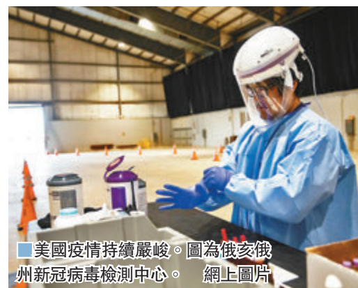
美國疫情持續嚴峻。圖為俄亥俄州新冠病毒檢測中心。

美聯社的民調亦顯示，支持特朗普與支持民主黨候選人拜登的選民之間，對疫情的态度截然不同。36%的特朗普支持者認為新疫情已經完全或接近受控，47%認為某種程度已受控；相反拜登支持者中，多達82%認為疫情完全未受控。在大選中由特朗普取得的州份中，亦普遍有過半數受訪者認為疫情已經受控。