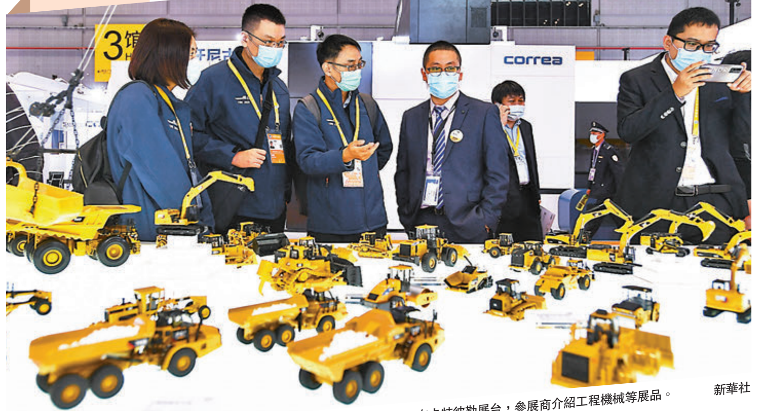
在卡特彼勒展台，參展商介紹工程機械等展品。