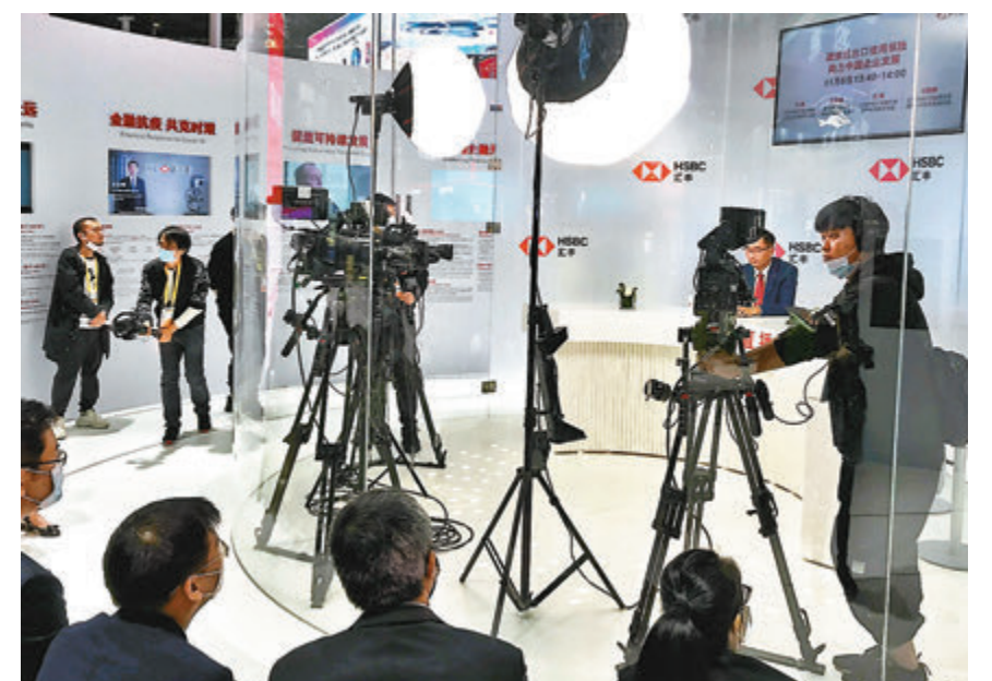
不少服務貿易類企業展台上設置播區介紹自身服務。

商務部當天公布報告稱，儘管疫情給中國經濟造成暫時性影響，但中國服務進口的長期目標沒有變。未來五年，中國旅行進口有望突破1萬億美元；知識產權使用費、電信計算機和信息服務、金融服務、保險服務、其他商業服務等數字服務進口累計將超過1.3萬億美元。