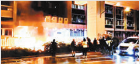
去年10月14日，暴徒使用汽油彈襲擊旺角警署。

判刑： 判囚3年4個月。法官郭啟安判刑時指，雖然被告是受人指使，涉案物品亦由他人提供，但並非單獨行事，還戴着蒙面的頭套以逃避追查，屬有計劃地針對警員或警署縱火，行為嚴重挑戰法治，情節嚴重，屬加刑因素。雖然涉案汽油彈並未起火致人傷亡，惟汽油彈狀態不穩定，在人口稠密下易造成人命傷亡。綜合被告的犯案行為，判刑須具阻嚇性至關重要。