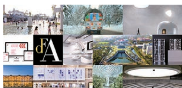
「DFA亞洲最具影響力設計獎」是香港設計中心其中一個重要獎項，表彰傑出設計項目。

2020年「DFA設計獎」日前宣布本年度的得獎者名單，獎項包括「DFA亞洲設計終身成就獎」、「DFA設計領袖獎」及「DFA世界傑出華人設計師」三個設計界個人殊榮；及「DFA亞洲最具影響力設計獎」，共197個設計項目獲嘉許；此外，16位香港年輕設計精英獲頒「DFA香港青年設計才俊獎」。