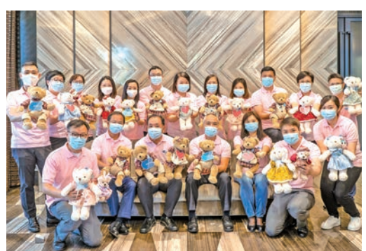
港基舉辦「愛同行 傳善心」熊熊同行慈善義賣活動，為多間合作社福機構籌款，幫助社區有需要人士。

「港基愛心義工隊」去年服務逾18000小時，並連續12年榮獲社會福利署推廣義工服務督導委員會及義務工作發展局頒發「壹萬小時義工服務獎」，去年更獲得「香港義工團」(商界團體)「最高服務時數獎——銀獎」，以及由香港生產力促進局及公民教育委員會頒發「第十屆香港傑出企業公民嘉許標誌(義工隊組別)」。