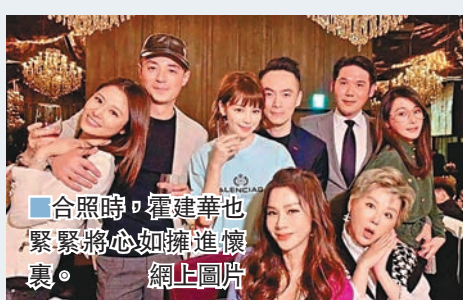
合照時，霍建華也緊緊將心如擁進懷裏。