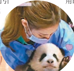
成員抱起熊貓BB時明顯帶妝。網絡截圖