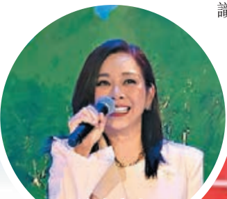
現在在內地，松松可以繼續工作。