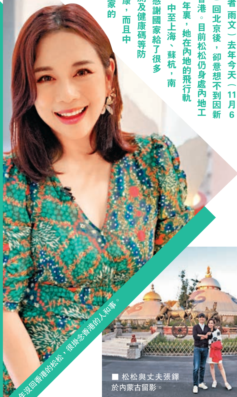
一年沒回香港的松松，很掛念香港的人和事。