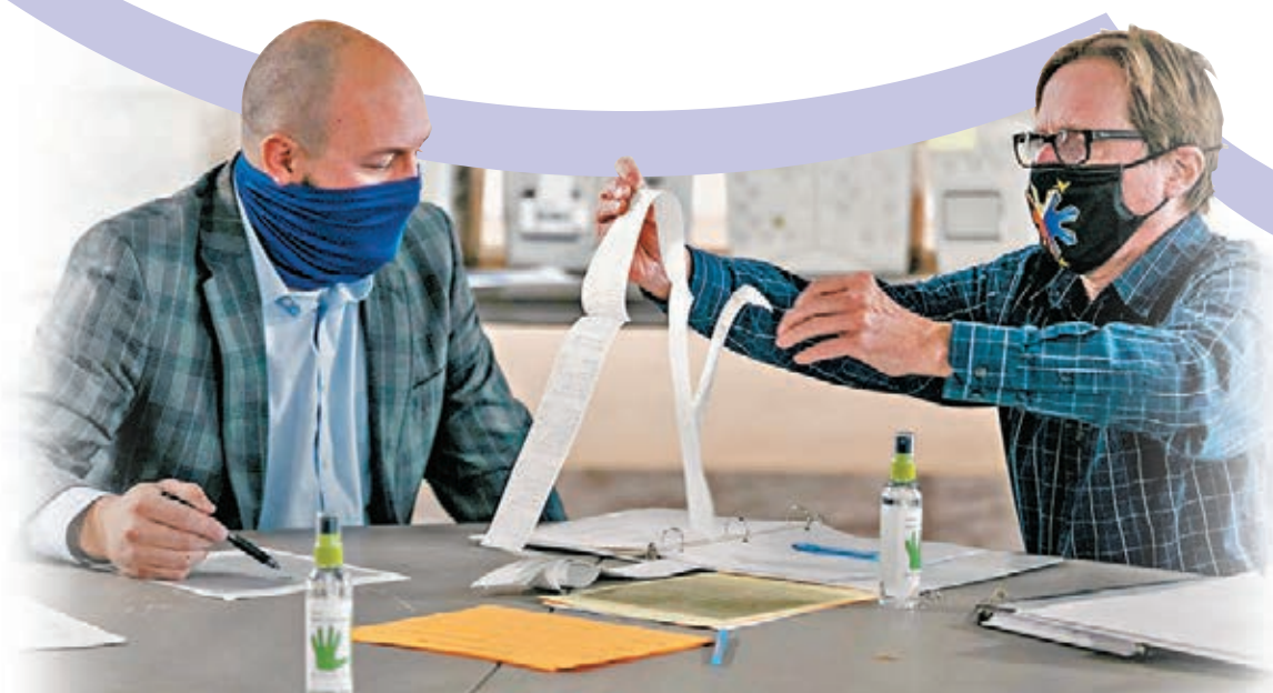
在密州一起參與點票。