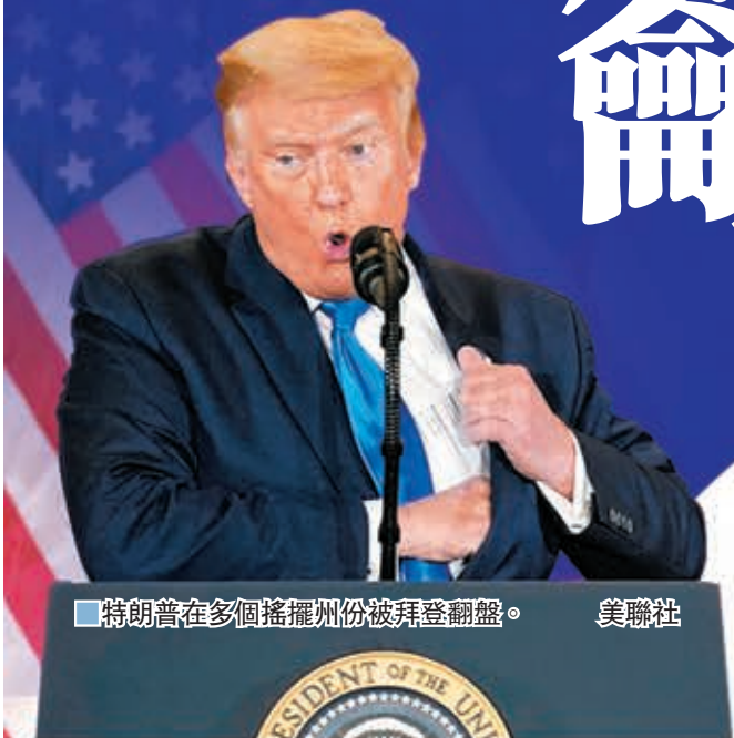
■特朗普在多個搖擺州份被拜登翻盤。

美國大選的點票工作繼續進行，民主黨總統候選人拜登在多個搖擺州份的票數反先總統特朗普，在密歇根州和威斯康星州勝出，再取得26張選舉人票，累計奪得264張選舉人票，距離當選門檻只差6票。拜登前日下午發表演說，繼續呼籲支持者保持耐性，等待全部選票點算完成，「我們相信將會勝出」。 另一邊廂，特朗普團隊揚言將向最高法院提出訴訟，要求4個搖擺州暫停點票或重新計票，特朗普指今次選舉出現嚴重舞弊，因此希望訴諸法律，確保選舉公正。