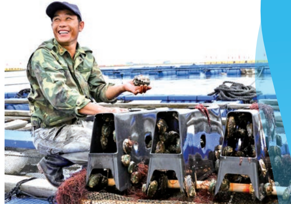
福建省寧德市霞浦縣北壁鄉升級改造後的海上鮑魚養殖區，漁民收穫長勢良好的鮑魚。

全國政協常委曹衛星提出，優化海洋產業結構，促進產業轉型升級。他建議培育壯大海洋戰略性新興產業，推動海水淡化、海洋可再生能源利用、海洋藥物和生物製品的快速發展，鼓勵發展海洋信息、郵輪遊艇、海洋文化等海洋高端服務業，推動海洋漁業、船舶與海工裝備產業、海洋交通運輸業等海洋傳統產業轉型升級，盡快化解海洋船舶、海洋工程裝備領域全球產業鏈「短鏈化」影響。全國政協委員蔣和生特別提到了海洋牧場的建設問題。在他看來，海洋牧場有望成為海洋漁業新的經濟增長點。他建議支持國內大企業遠洋捕撈，加大對珊瑚白化和救治問題的研究支持，並研究確定四大片海域休漁時間。全國政協委員戴北方建議加快海洋高校建設，加強深海科考中心建設，同時，大力發展海洋金融。海洋經濟是行業特徵明顯、專業技術門檻較高的領域，需要長期性、專業化的金融服務和風險管理。當前，全球沒有專門的海洋銀行，我國建設國際海洋開發銀行，可以作為推進全球治理的新型國際金融平台。建議央行和有關部委對建設國際海洋開發銀行給予專業指導和後續支持。同時，繼續強化商業性金融對海洋經濟的服務保障功能，優化海洋金融發展環境，促進海洋金融要素集聚。戴北方還提出深化涉海政策改革，他建議在海洋中心城市試行海南自由貿易港的有關政策。比如，推動國際航行船舶燃油經營資質、外國籍船舶臨時進入非對外開放水域等審批權下放；探索建設國際遊艇旅遊自由港等，支持郵輪旅遊發展；改革國際船舶登記制度，鼓勵其在海洋中心城市註冊及掛旗，支持國際知名船級社在海洋中心城市開展業務。