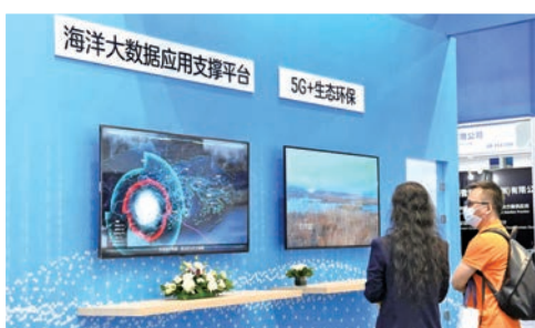
觀眾在2020海博會上了解5G+海洋技術

步推動大型設備等國有科研資源向符合條件企業開放，形成創新合力。在全國政協委員何廣順看來，經略海洋必先認知海洋。智慧海洋是認知海洋、經略海洋的整體解決方案，是海洋強國建設的基礎性、戰略性工程，應借鑒「航天工程」等重大工程的體系化管理與建設模式，構建以自主可控的海洋信息基礎設施為核心的智慧海洋體系，打通涉海部門間信息壁壘，整合各類海洋信息資源，實現海洋透視感知、信息資源共建共享和智慧應用。具體可在四個方面發力，即加快海洋信息基礎設施建設，提高海洋自主感知能力，促進海洋信息資源開放共享，推動海洋信息智慧應用服務。全國人大常委會委員吳立新關注的是海洋科技創新體系建設問題，結合海洋科技創新學科跨度大、投入高、周期長、風險大等特徵，他提出了四個方面的建議：應探索構建統籌協調機制，形成創新合力；加大海洋科技創新投入，形成先發引領優勢；加快培養與引進帥才型科學家並給予更大科研自主權；拓展海洋科技國際合作，助力構建人類海洋命運共同體。