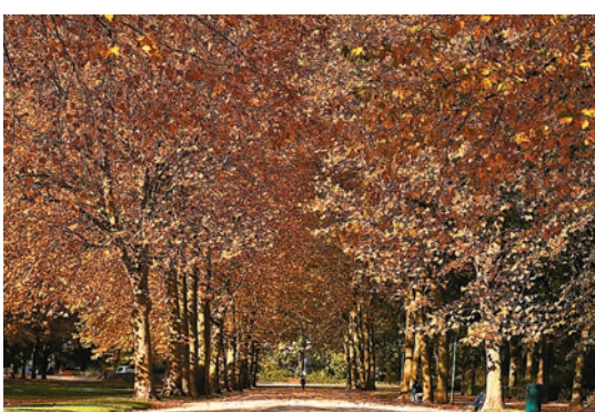
五十周年紀念公園拍攝的秋景

日前，比利時布魯塞爾秋意正濃，景色怡人。在五十周年紀念公園，人們在公園裏騎行、散步，這兒是一個大型城市公園，位於布魯塞爾歐洲區最東部，當中U形建築物的大部分建築由利奧波德二世領導的比利時政府委託，為1880年的全國展覽會建造，以紀念比利時獨立50周年。如今的中心建築凱旋門建於1905年，取代了以前的臨時版本。建築材料採用鐵、玻璃和石材，象徵着比利時的經濟和工業水平。周圍30公頃公園遍布花園、噴泉和瀑布，到了1930年，這