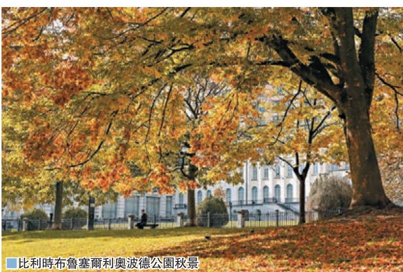
比利時布魯塞爾利奧波德公園秋景