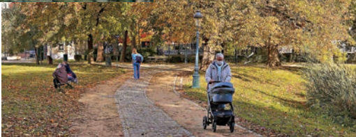
人們在利奧波德公園散步