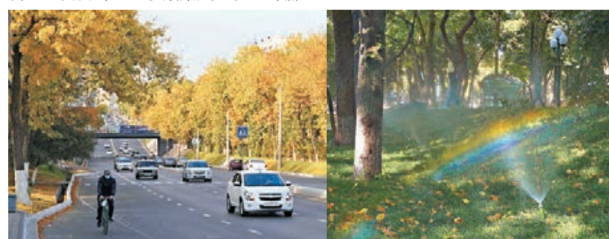
在烏茲別克斯坦首都塔什幹拍攝的秋色