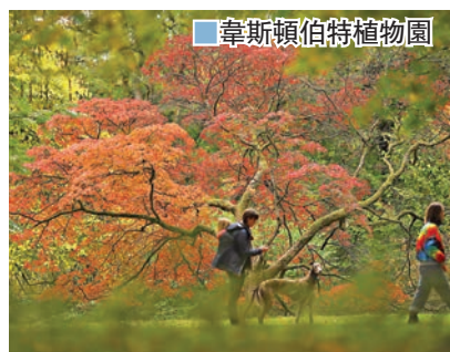
韋斯頓伯特植物園

植物園由18000餘種樹木和灌木組成，覆蓋面積達600英畝。園內長達27公里的小徑深受遊客喜愛，走在這裏，你可以驚喜地發現種類繁多的罕見樹木。植物園內有兩個重點區域需好好觀賞，其中一個是老植物園區，這是一個精心設計的園林景觀，其間分布着來自全球各地的罕見樹木，最早可追溯到19世紀50年代。另外一個則是巨盤木區，雖然這裏分布着很多異國樹木，但其中心是一個傳統的工作林地，可以追溯到13世紀。