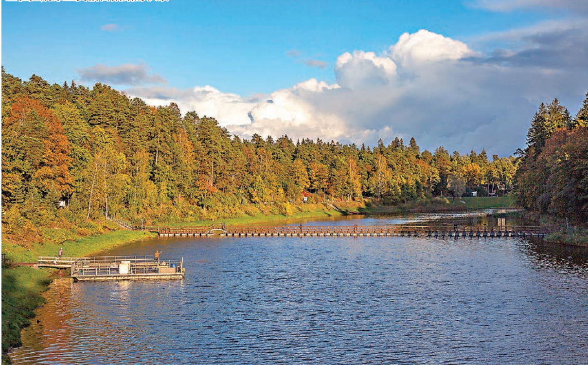
在拉脫維亞奧格雷拍攝的秋景