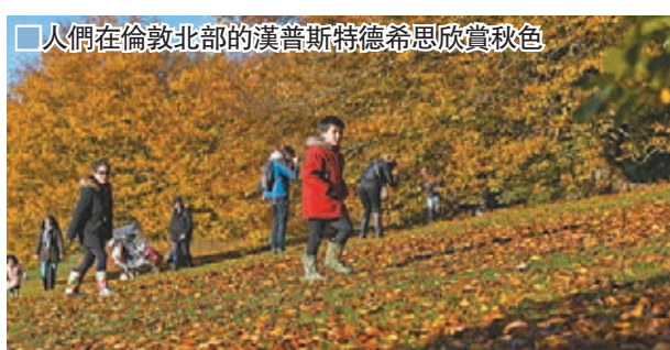
人們在倫敦北部的漢普斯特德希思欣賞秋色