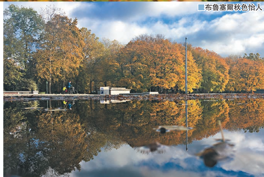
布魯塞爾秋色怡人