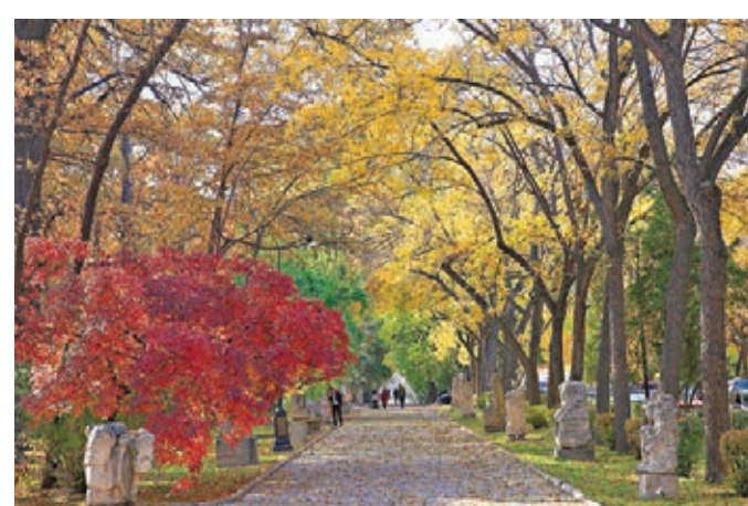
在比什凱克拍攝的橡樹公園景色

在中亞地區，也有兩個地方在這個秋天景色極美，例如在烏茲別克斯坦首都塔什幹的秋色，秋意盎然，景色美不勝收。同時，在吉爾吉斯斯坦首都比什凱克近日亦秋意漸濃，城市裏共有20多個公園，尤其是橡樹公園，是比什凱克歷史最久的公園，其歷史已逾百年。公園裏，橡樹的落葉如同地毯一般，另有一番風味。