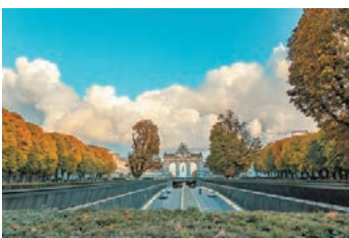
在五十周年紀念公園拍攝的美景

兒成為了休閒公園。在位於布魯塞爾利奧波德區(歐洲區)的另一個公園——利奧波德公園，佔地10公頃，毗鄰歐洲議會的所在地保羅——亨利·斯巴克大廈。公園的突出特點是它的池塘，水源來自馬勒貝克溪，有許多珍稀樹木和動物，如綠頭鴨、黑水雞，甚至埃及雁和紅領綠鸚鵡，都在這種城市環境中茁壯成長。現在，利奧波德公園秋意洋溢。