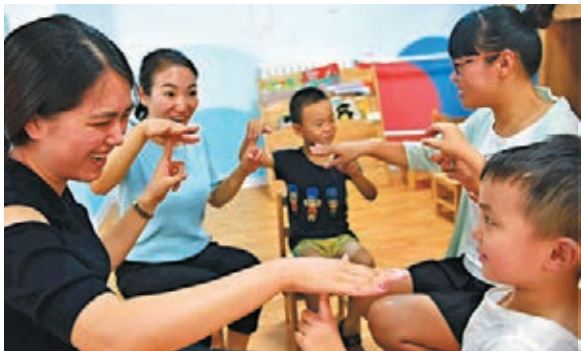
■ 在河北石家莊一所「家園共育」式的學校裏，老師帶着家長與孩子玩遊戲，培養親子默契。資料圖片

對於家長群的作用，中國教育科學院研究員儲朝暉表示，家長群其實具有雙面性，它是一個溝通的平台，也是個濃縮的「小社會」，畢竟家長的生活背景、文化素養各不相同，如何讓家長群發揮最大價值，才是學校、老師、家長應該共同追求和思考的。要建設一個溝通交流信息，而不是表達意見的平台，從而使家長群與它的功能相符，同時不會帶來很多的矛盾。