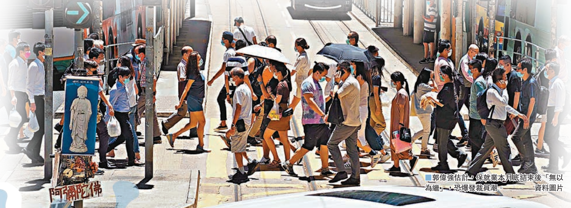
郭偉強估計，保就業本月底結束後「無以為繼」，恐爆發裁員潮。資料圖片