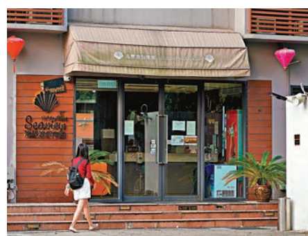
梅窩「海景渡假樂園」群組再多兩人確診。資料圖片

檢測。 對醫管局在三間門診診所試行設置自動派發樣本瓶機，他認為方向正確，市民可24小時取樣本瓶，若試行成效理想，政府可在港鐵站設置自動派發樣本瓶機以方便市民。他並建議可採用流動收集車形式，在方便市民的地點收集樣本，毋須到診所交回。 現時採集深喉唾液樣本，要求市民留起床後第一啞唾液，何栢良指，只要市民在2小時前無飲食或刷牙漱口，深喉唾液樣本效果與剛起床時質素相若，市民可在取樣本瓶後於空曠地方留樣本並即時交回。 針對梅窩近日出現的 staycation 群組，而日前一名確診非法入境女子則曾在大圍鳳樓接客，政府昨晚宣布，今日起一連三