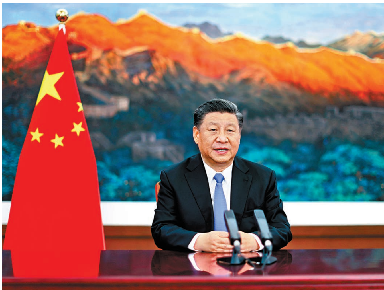
■昨晚，第三屆中國國際進口博覽會開幕式在上海舉行，國家主席習近平以視頻方式發表主旨演講。

香港文匯報訊 據新華社報道，第三屆中國國際進口博覽會開幕式昨晚在上海舉行，國家主席習近平以視頻方式發表主旨演講。習近平指出，新冠肺炎疫情使世界經濟不穩定不確定因素增多，但中國擴大開放的步伐仍在加快，各國走向開放、走向合作的大勢沒有改變。各國要攜手致力於推進合作共贏、合作共擔、合作共治的共同開放。中國將秉持開放、合作、團結、共贏的信念，堅定不移全面擴大開放，讓中國市場成為世界的市場、共享的市場、大家的市場，推動世界經濟復甦，為國際社會注入更多正能量。