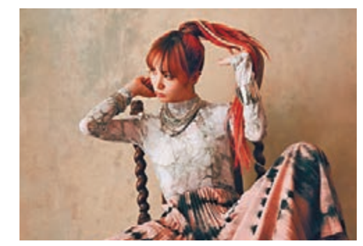
電影版《鬼滅之刃》氣勢如虹，連帶LiSA的人氣亦水漲船高。

綜合中央社報道 日本超人氣漫畫《鬼滅之刃》改編的動畫電影在日本大賣，由歌手LiSA演唱的主題曲《炎》也連續3周盤踞日本ORICON公信榜銷售冠軍，追平12年前男子團體SMAP創下的紀錄。鬼滅之刃改編的動畫電影《鬼滅之刃劇場版無限列車篇》，日本從10月16日上映到11月1日，票房超過157.9億日圓(約港幣11.7億元)，已成日本影史上第10大賣座電影。據日本ORICON NEWS報道，LiSA演唱的鬼滅之刃電影版主題曲《炎》，在11月3日發表的ORICON每周單曲銷售排行榜中排名第一，共賣出3.2萬張，且是連續3周獲得銷售冠軍，3周累積銷量14.1萬張。據悉，上一次達到連續3周銷售冠軍紀錄的單曲，是SMAP在2007年底發售的單曲《子彈Fighter》，已經是約12年又10個月前。