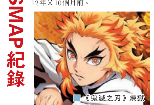
《鬼滅之刃》煉獄杏壽郎。

綜合中央社報道 日本超人氣漫畫《鬼滅之刃》改編的動畫電影在日本大賣，由歌手LiSA演唱的主題曲《炎》也連續3周盤踞日本ORICON公信榜銷售冠軍，追平12年前男子團體SMAP創下的紀錄。鬼滅之刃改編的動畫電影《鬼滅之刃劇場版無限列車篇》，日本從10月16日上映到11月1日，票房超過157.9億日圓(約港幣11.7億元)，已成日本影史上第10大賣座電影。據日本ORICON NEWS報道，LiSA演唱的鬼滅之刃電影版主題曲《炎》，在11月3日發表的ORICON每周單曲銷售排行榜中排名第一，共賣出3.2萬張，且是連續3周獲得銷售冠軍，3周累積銷量14.1萬張。據悉，上一次達到連續3周銷售冠軍紀錄的單曲，是SMAP在2007年底發售的單曲《子彈Fighter》，已經是約12年又10個月前。