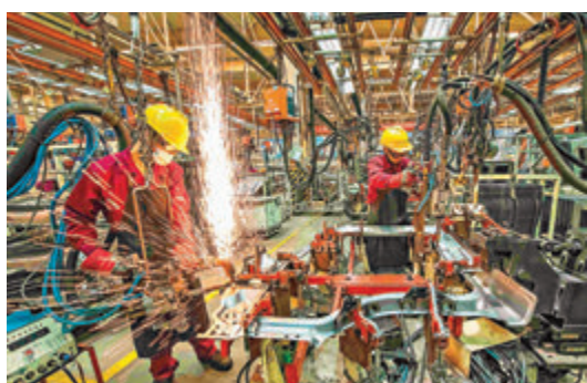
■內地製造業加速擴張，10月財新PMI指數升至53.6，創2011年2月以來新高。

軒認為，10月鋼鐵日產量、高爐開工率、汽車銷量等高頻數據整體強於9月，PMI先行指標顯示新訂單及新出口訂單不弱於9月，總體經濟運行保持樂觀。不過貨幣政策或將邊際收緊，資金利率價格近期已大幅提升。