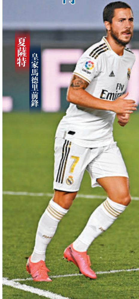
夏薩特 皇家馬德里前鋒