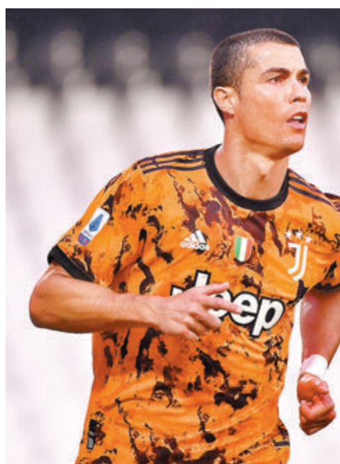
C朗甫復出便梅開二度。