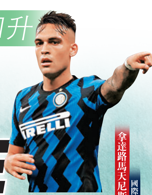
拿達路馬天尼斯 國際米蘭前鋒