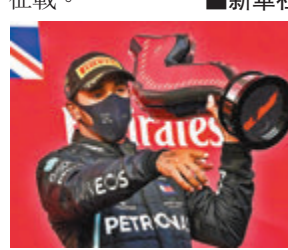
咸美頓追平舒密加的年度車手「七冠王」紀錄在望。法新社

示，「我很希望明年繼續出現在比賽中，只是還不太確定，有太多讓我開心和快樂的事等著我，時間會給出答案。」賽道外，咸美頓還有包括時尚、音樂等在內的諸多興趣。咸美頓補充說：「我感覺自己的狀態很好，還能繼續比賽一段時間，只是有太多事情積壓在我腦海中等著我去做。」平治車隊老闆沃爾夫賽後則表示，相信咸美頓只是過於疲憊，並受到一些情緒影響才說出有關言論，相信他下季還會繼續征戰。 咸美頓追平舒密加的年度車手「七冠王」紀錄在望。法新社