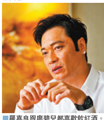
羅嘉良跟廖碧兒都喜歡飲紅酒。