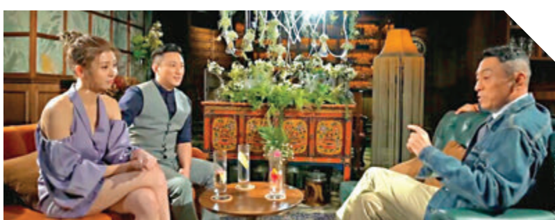
姜皓文亮相由張秀文與崔建邦主持的節目。