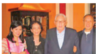
（右起）中國前外長李肇星、美國前國務卿基辛格、李肇星夫人及陳復生合照攝於2009年5月。