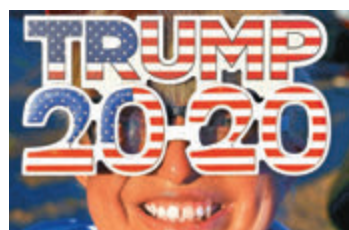
「特粉」為特朗普打氣。

白宮官員透露，總統特朗普將在大選日當晚，於白宮東廳舉行選舉之夜派對，擬邀請約400名嘉賓出席。外界憂慮在新冠疫情肆虐下，特朗普仍在白宮舉行大型聚會，恐增加疫情散播風險。