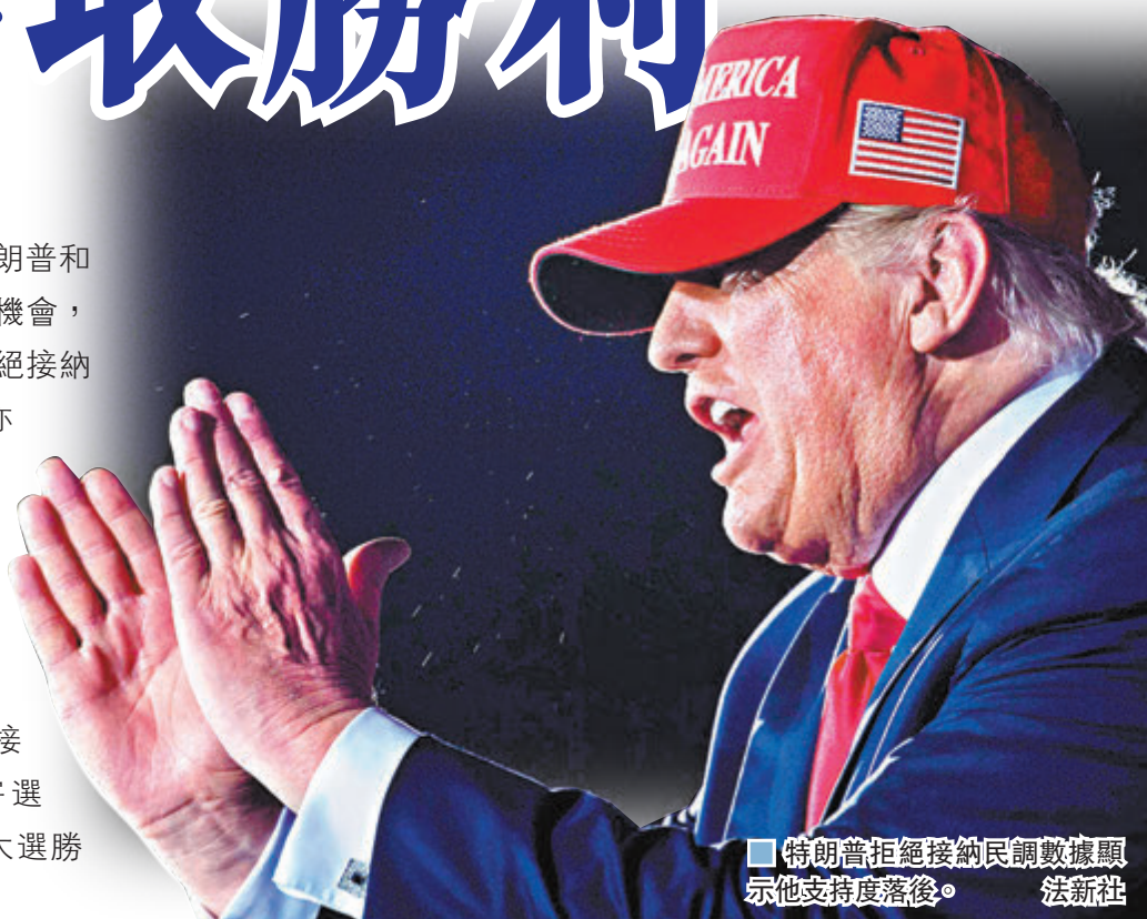
特朗普拒絕接納民調數據顯示他支持度落後。

美國今日正式迎來大選日，總統特朗普和民主黨總統候選人拜登前日把握最後機會，在多個關鍵州份拉票。特朗普不單拒絕接納民調數據顯示他支持度落後，亦繼續質疑郵寄投票拖長點票所需時間，將引致選舉舞弊，當地媒體報道，若特朗普在今晚的初步結果領先，他計劃立即宣布自己勝出，變相拒絕接納大選日之後點算的郵寄選票，拜登直斥特朗普「竊取大選勝利」的圖謀不會得逞。