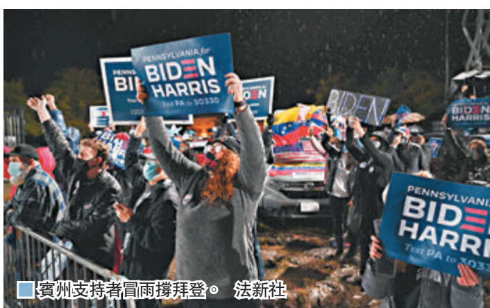
賓州支持者冒雨擁護拜登。