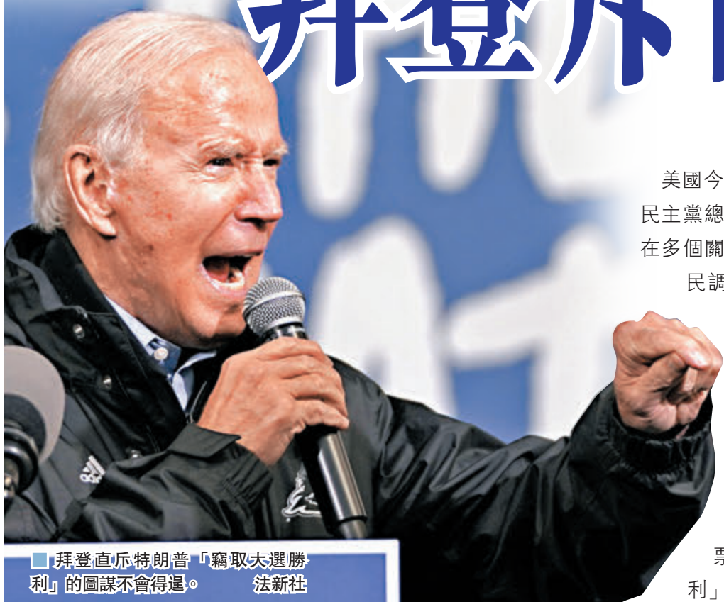
拜登直斥特朗普「竊取大選勝利」的圖謀不會得逞。