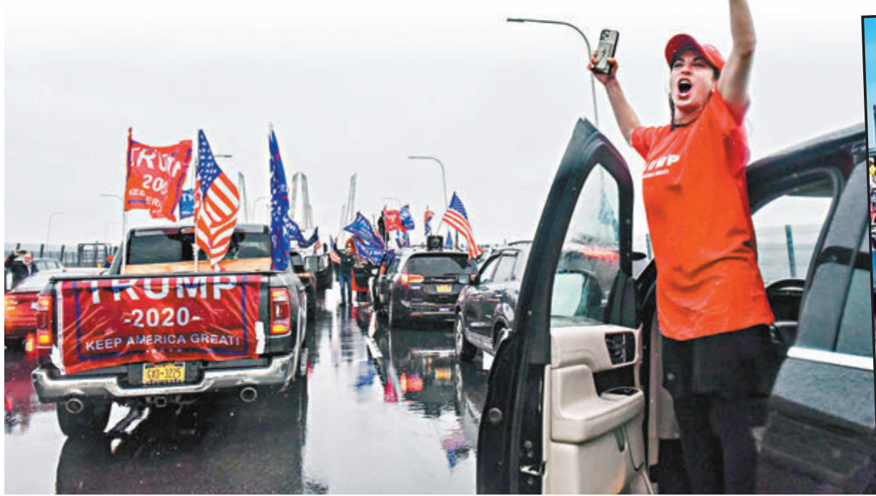
▲ 特朗普支持者駕車堵塞紐約科莫大橋，造成交通癱瘓。