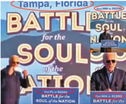
■ 拜登在明尼蘇達州的影片(右)被篡改成佛州(左)。