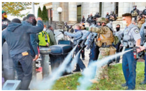
■ 警方驅趕示威人士。