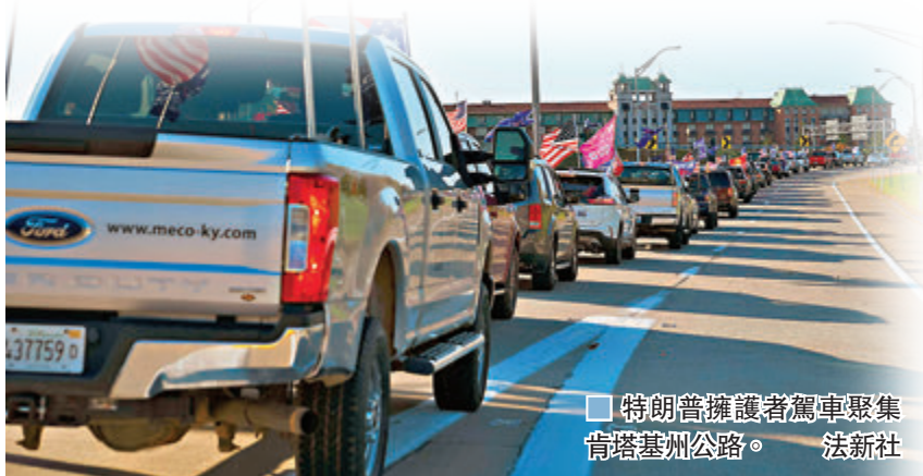
■ 特朗普擁護者駕車聚集肯塔基州公路。