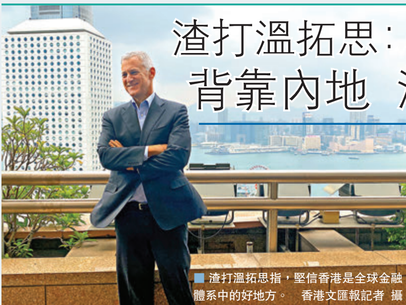
渣打溫拓思指，堅信香港是全球金融體系中的好地方。

香港文匯報訊(記者馬翠媚)雖然疫情來襲，加上去年社會事件夾擊，香港國際金融中心地位未見動搖。渣打(2888)行政總裁溫拓思早前接受訪問，形容本港具有非常強大及持久優勢，堅信香港是全球金融體系中的好地方，他又指在中國業務看到光明前景，因此未來會在中國戰略上進行更多投資，包括大灣區。