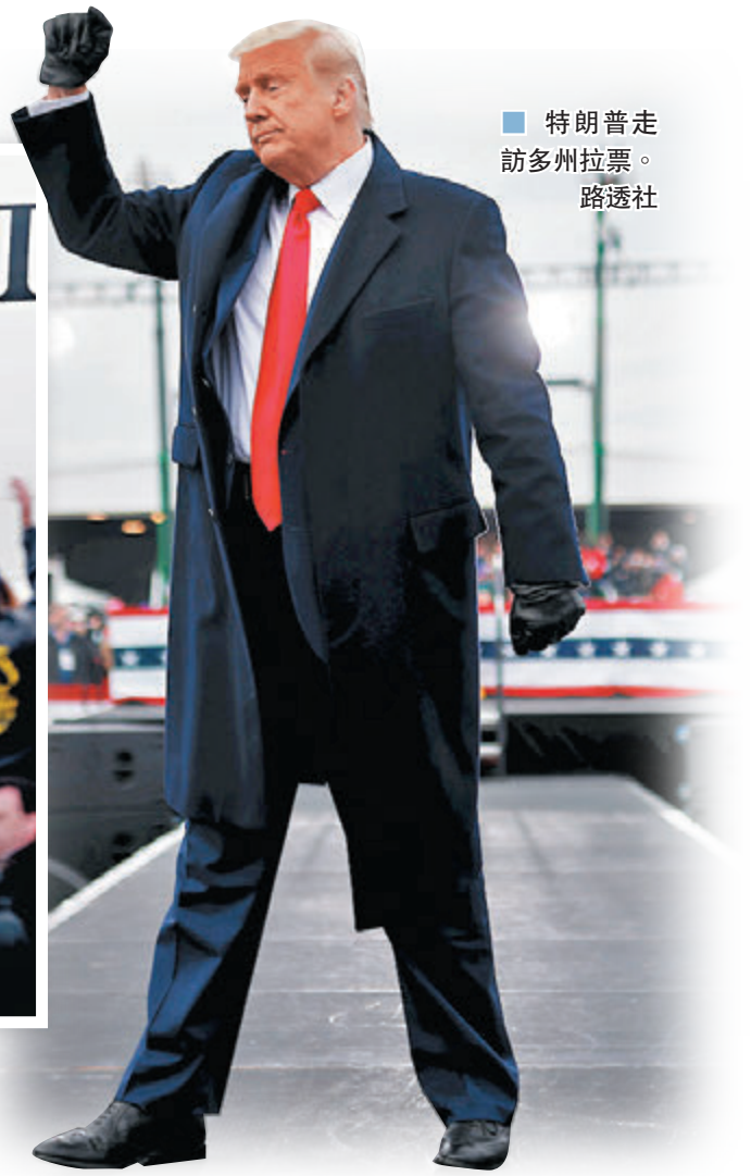
■ 特朗普走訪多州拉票。

2020年美國大選明日便會舉行，截至周六晚，全美有近9,200萬選民已經提前投票，佔上屆總投票人數逾2/3。競逐連任的總統特朗普昨日和今日馬不停蹄穿梭7個搖擺州份，密集式舉行12場造勢集會，冀保住4年前成為勝選關鍵的州份。他前日在賓夕法尼亞拉票時，再次炮轟郵寄選票制度，表示可能要等待數周才得知選舉結果，又指點算郵寄選票期間，或會出現一些「很差的事情」，但他未有詳細說明及列舉任何證據。