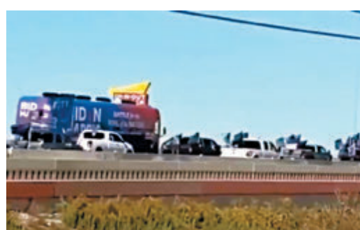
■ 拜登宣傳巴士「被圍」。