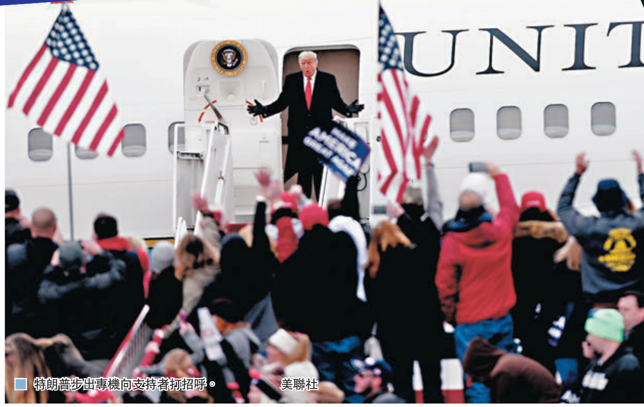
■ 特朗普步出專機向支持者揮手。