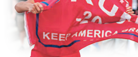
■ 特朗普支持者揮旗。

受新冠疫情影響，美國許多選民今年均選擇郵寄投票。然而佛羅里達大學的「美國選舉計劃」統計顯示，截至上周五，全美13個競爭最激烈州份中，仍有逾700萬張郵寄選票未送抵選舉辦公室，佔這些州份郵寄選票總數28%。總統特朗普在上屆大選中，在部分有關州份僅以數千票之差勝出，若大量郵寄選票無法及時送達，將影響大選結果，亦可能引發點票爭議。