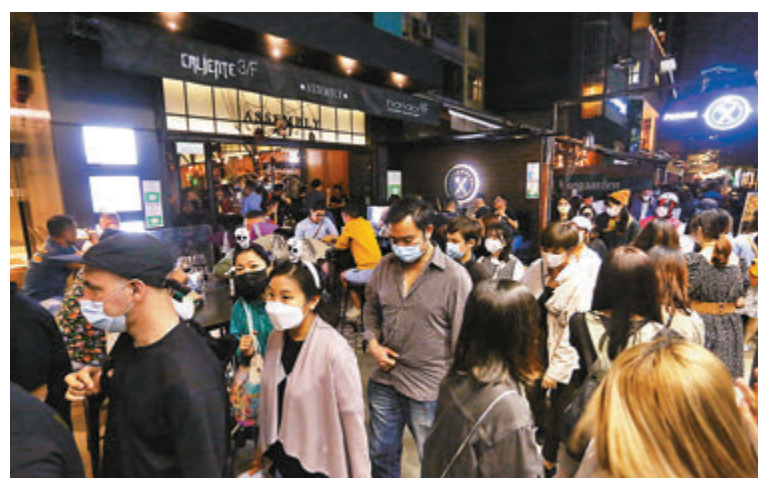
▲特區政府準備推出「安心出行」流動應用程式，市民可自行掃描場所的二維碼記下出行記錄。