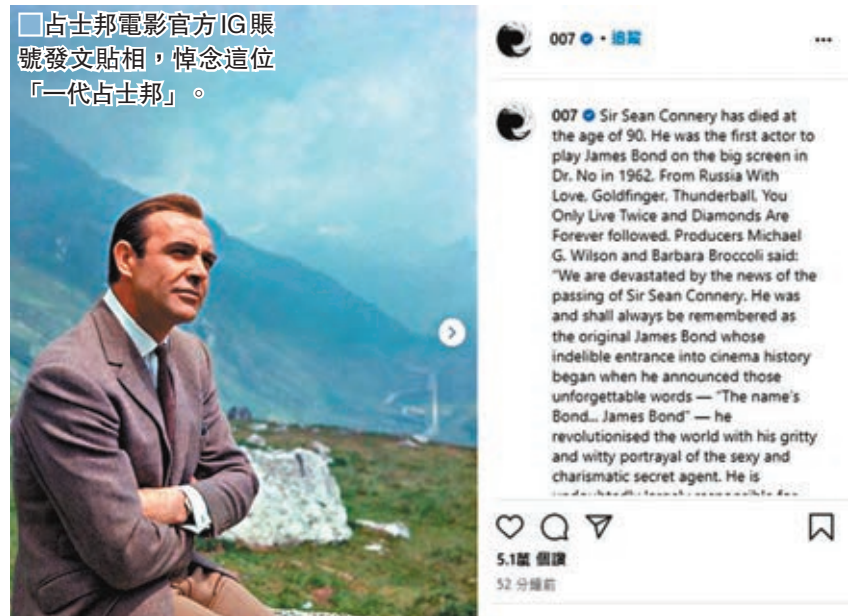
■占士邦電影官方IG賬號發文貼相，悼念這位「一代占士邦」。

辛康納利從影數十年，在多個頒獎禮獲取獎項，包括奧斯卡及金球獎。他在1988年憑藉電影《義膽雄心》(The Untouchables)獲頒奧斯卡最佳男配角獎。其他著名作品包括1974年的《火車謀殺案》(Murder on the Orient Express)、及1996年的《石破天驚》(The Rock)等。2000年，他更獲英女王封為爵士。今年8月，辛康納利慶祝90歲生日，同月他更成為由英國媒體《Radio Times》讀者票選出的史上最受歡迎占士邦男星。