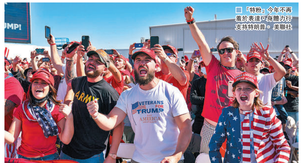
「特粉」今年不再羞於表達，身體力行支持特朗普。

調專家擔心，曾表示會在大選日投票的選民，若當地在選前疫情惡化，他們或不曾冒染疫風險投票，而票站亦可能因疫情關閉。此外，特朗普多次質疑郵寄投票存在舞弊，各州有關接受郵寄投票的期限亦引起爭議，蒙莫斯大學民調中心主任默里指出，大量郵遞投票或被列作廢票，而部分票站關閉令排隊候時間大幅增加，導致選民放棄投票，都是影響民調準確性的不確定因素。 ■綜合報道