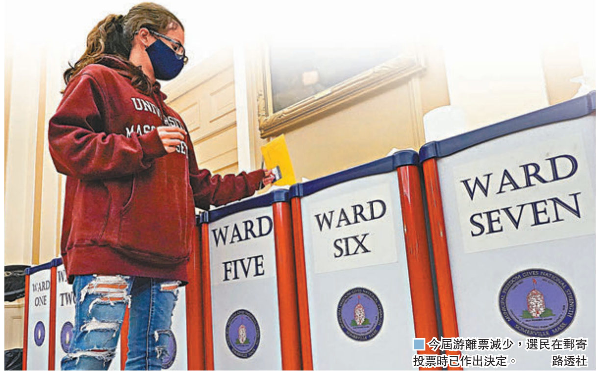
今屆游離票減少，選民在郵寄投票時已作出決定。

根據本月12日的數據模型顯示，特朗普只在8個搖擺州份的支持度，與拜登相比在誤差值內，即使特朗普最終在大選中全取這8州，仍可能在選舉人票上稍微落後，不敵拜登。 ■綜合報道