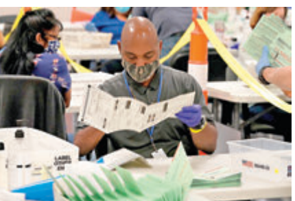
各州接受郵寄投票的期限引起爭議。

在2016年大選，民主黨候選人希拉里的民調佔優卻最終落敗，今屆大選拜登同樣在民調領先，有人質疑拜登會否倒灶。不過多間民調機構分析指出，今屆民調趨勢與上屆不同，拜登的全國支持度長期領先特朗普約8個百分點，兩人的支持度曲線基本上平行，罕見出現交