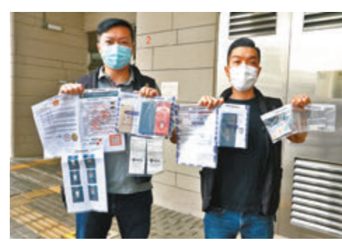
▲警方在被捕電話騙徒家中檢獲偽冒證件、文件及電話等證物。

第四宗案件發生於 9 月 21 日，15 歲受害人在秀茂坪安達邨家中收到同樣內容的電話，女「特務」上門向其收取 3,800 元人民幣後，再轉走其銀行內 20 萬元。