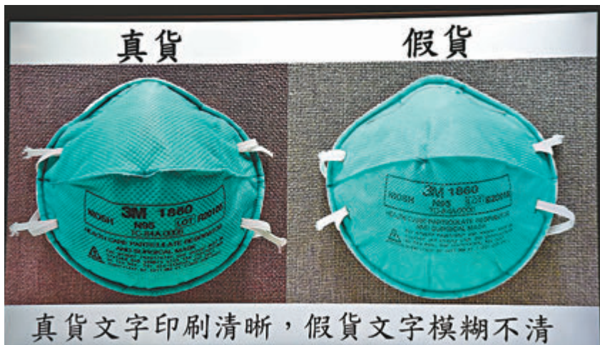
▲正貨口罩(左)的文字編印相當清晰，冒牌口罩(右)的文字編印相當模糊。