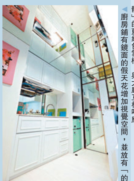
「靚」的藍綠色雪櫃，與大廳互相呼應。廚房鋪有鏡面的假天花增加視覺空間，並放有「的

最後當然不得不提女士最關心的梳妝枱：把組合廚櫃拉開時，就會出現一張飯枱，戶主可於沙發一側用膳，免去收納摺枱的麻煩；把飯枱揭開，則可以變成一張梳妝枱，下方亦可存放化妝用品。