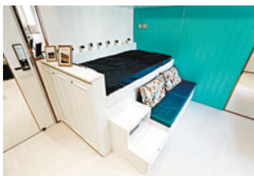
沙發位可供戶主看電視，亦可於沙發一側使用飯枱用膳。