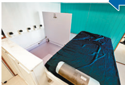
床下方可用來收納物品，最多可放多達 4 個行李箱。