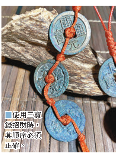
使用三寶錢招財時，其順序必須正確。

由於各位讀者未必相當了解古錢幣，不會分別生坑錢及傳世錢，亦經常發生買錯，買假或買了兩個相同錢幣的「大頭槓」問題，也有可