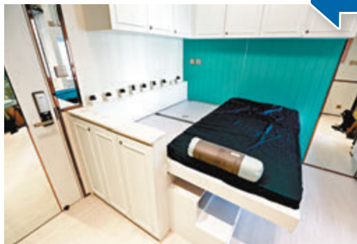
把睡床拉開，再把靠牆的層板放下來，即可由 3 呎床變成 4 呎雙人床。