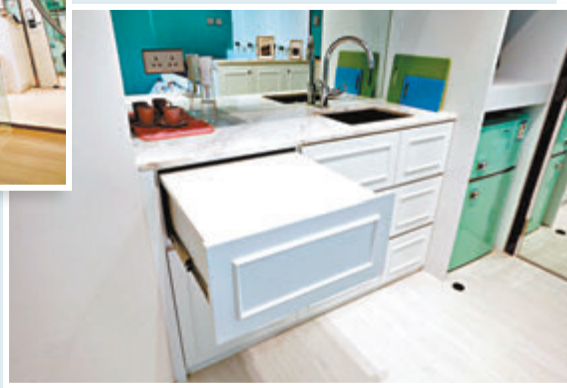
把組合廚櫃拉開時即可見一張小型飯枱，把飯枱揭開，則可變成一張梳妝枱，下方亦可存放化妝用品。